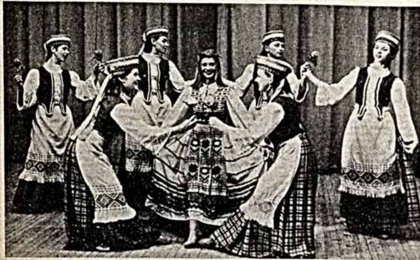
Большую любовь и признание жителям Вильяксского уезда завоевала народный танец и песни «Нерисе»...