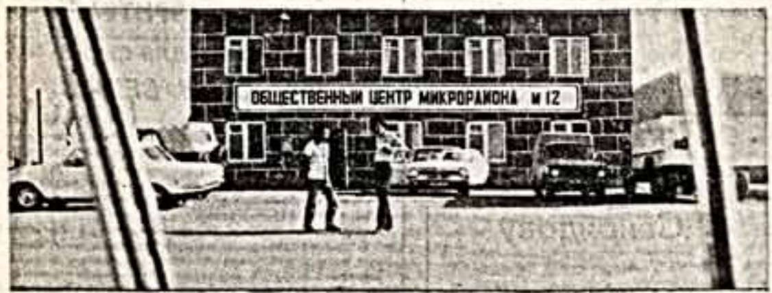
Гостеприимно вьют свои общественные центры всех жилых районов города Гурьев, пригласив жителей на интересную встречу на беседе, вечер отдыха или время и народных депутатов, на занятия в детских дворовых клубах. Вся работа ведется на

общественных началах, активно действует совет секретарей партийных организаций учреждений и предприятий, входящих в микрорайоны. Главная цель работы общественных центров — это формирование хороших микроклимата в жилом квартале, подни-