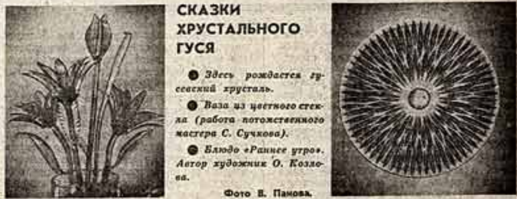
Гусевский хрустальный завод — старейший предприятия страны, известное на весь мир производством хрустальной посуды, изделий из хрустальной посуды, известное на весь мир производством хрустальной посуды, известное на весь мир производством хрустальной посуды...

Такая, на мой взгляд, любопытная деталь: если бы собрать всех молодых актеров из тех одиннадцати фильмов, о которых идет речь, получились бы прямо-таки художественная галерея наших современников — красивые рослые с лицами значительными, одухотворенными. Такова фактура молодых актеров, представителей своего поколения. Но вот они «рачуются» по фильмам на современную тему. И тут начинается наступление на красоту: их старательно присеивают под обтянутые, средние, будто бы типичных людей, а иногда и «термостатной». Герои буквально на глазах тускнеют, делаются даже меньше ростом. Заниженный нравственный идеал, естественно, приносит ущерб идеалу эстетическому. И никакие атрибуты современности: модные наряды, искусно выстроенные бутылочные космонавты не в силах убедить, что герои живут рядом с нами.