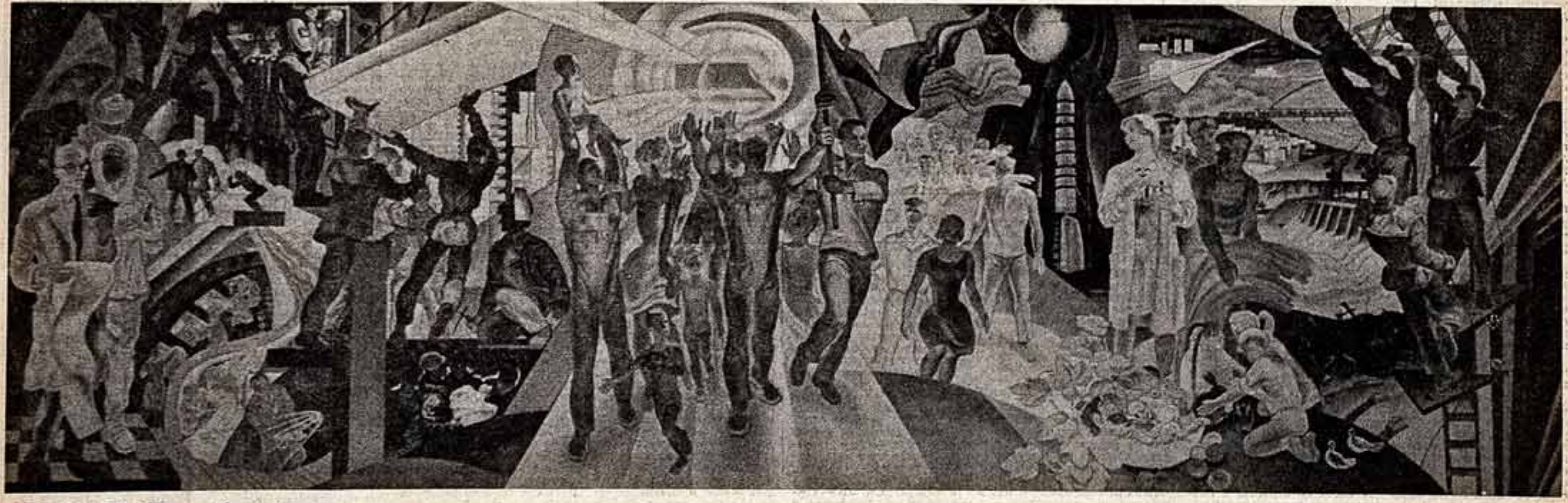
Ю. КОРОЛЕВ. Панно «Страна Советов».

Нам многое дается, но с нас много и спрашивается. И труженики Алтая делают все, чтобы расширить наш любимый край, чтобы доброе слово о хлебом Алтае, о наших земледельцах было слышно повсюду в нашей великой стране.