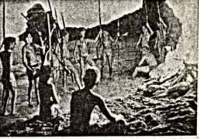
Вышедший в 1963 году на экраны фильм — экранизация знаменитого романа лауреата Нобелевской премии Уильяма Голдинга «Полярный мушкетер»...

Весь мир знает Дональда Дакса, всегда безупречно отточенный и мультимедийный Уми много десятилетий он и его друзья Минни Маус, Гуффи, Плуто и другие потешают своим проказам и детей, и взрослых.