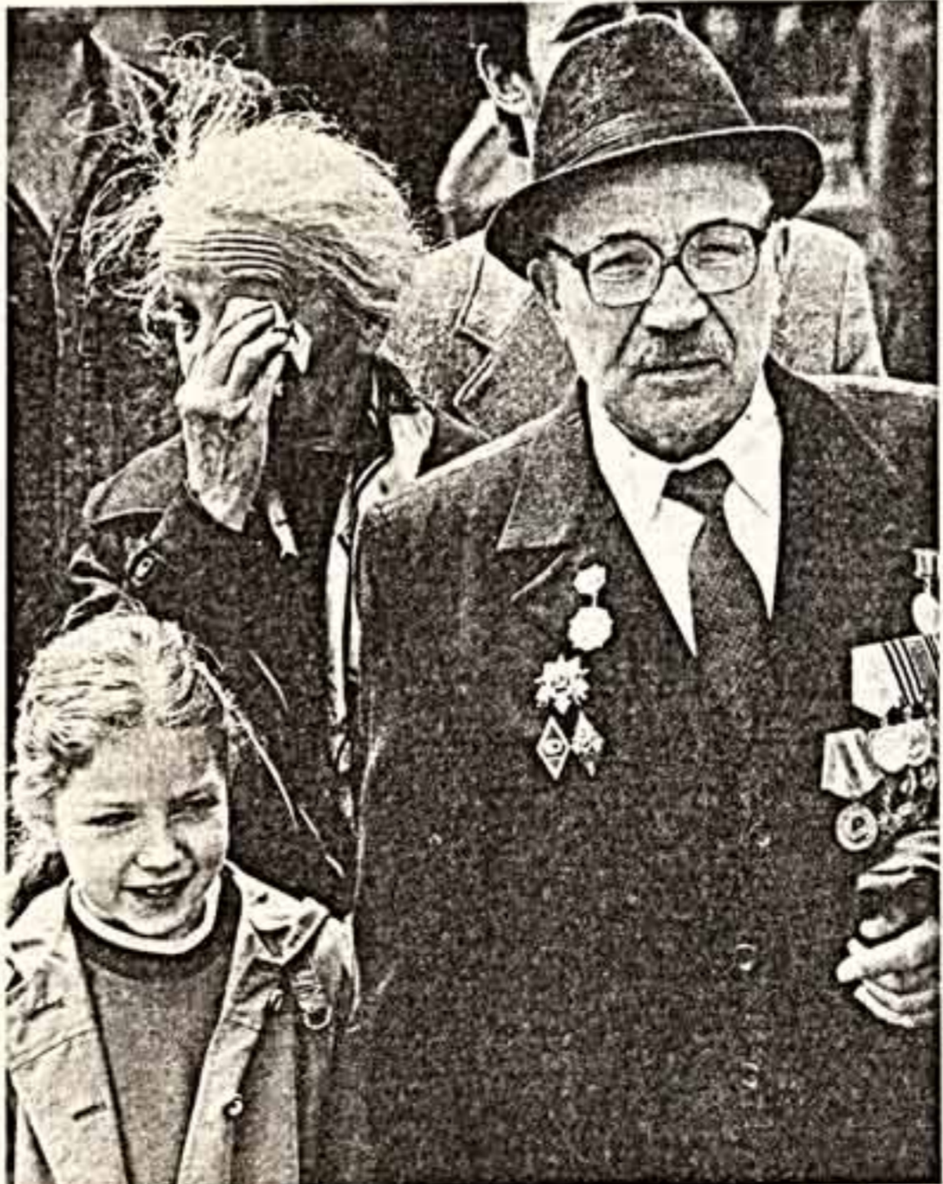
Теоры и учки Победы • Американцы — полковоенные участники праздника • Вспомнил он лету...

(Окончание на 8-й стр.)