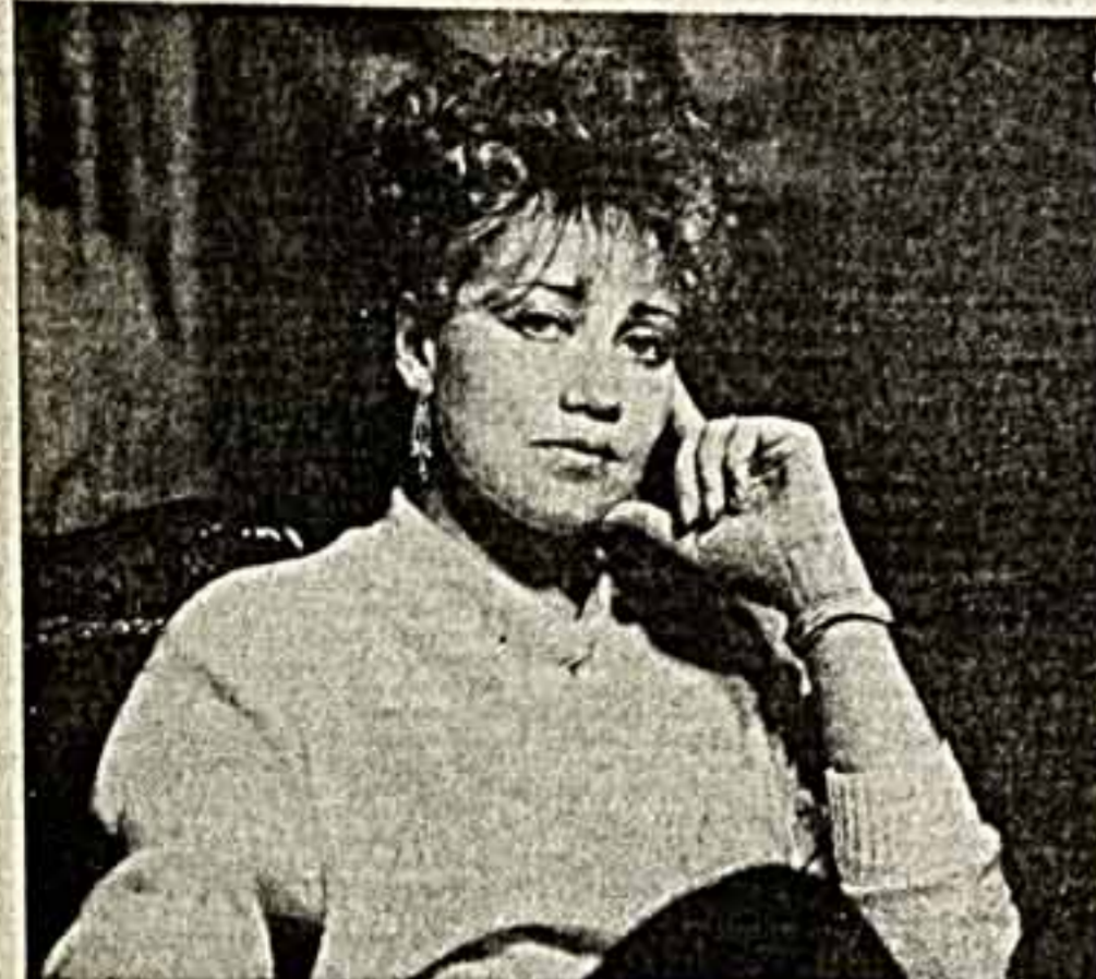
ПРОИСХОДИЛО СОБЫТИЕ, редкие для Кировского театра, с его великодушным, много и плодотворно самостоятельно работающим оркестром. Был вечер музыки Сергея Прокофьева, звучал в-в симфония и оратория Ивана Грозного...