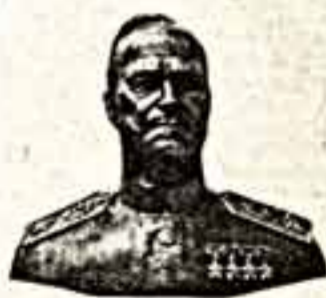
архитектор С. П. Хаджиберов).

И, наверное, есть своя логика и справедливость в том, что именно в наше время всеобщего разброда и шатания, беспощадной правды, крушения идолов и идеолов у здания Генерального штаба на улице Фрунзе установлен бронзовый бюст и мемориальная доска четиридцати Героям Советского Союза, маршалу Советского Союза Г. К. Жукову (скульптор народный художник РСФСР Ю. Г. Орехов,