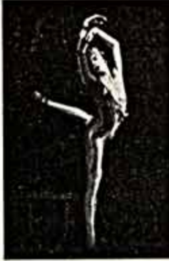
Воронежский и другие. У нас много индивидуальных заказов.

Надеюсь, московские власти пойдут нам навстречу и тоже помогут в открытии балетного магазина-салона, куда сможет прийти каждый, получить консультацию фitters — эсперта, помогающего подобрать удобную обувь и одежду, и, конечно, купить, сделать заказ. Ведь это вопрос, в сущности, не коммерции, а развития нашего балета.