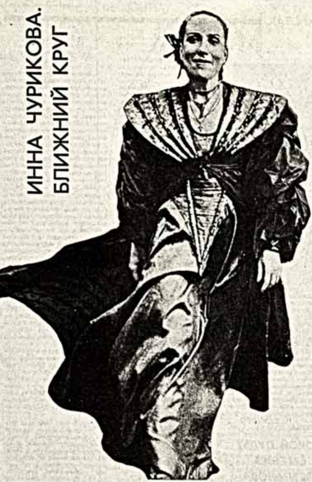
ИННА ЧУРИКОВА. БЛИЖНИЙ КРУГ