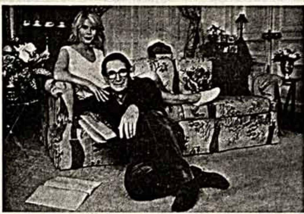
Имя известного французского режиссера Робера Оссеяна на французской театральной сцене занимает особое место...