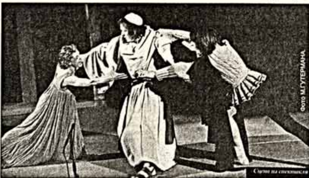
Сцена из спектакля "Ромео и Джульетта"