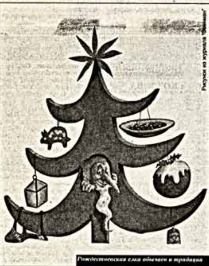
Рисунок из журнала

Праздник Рождества связан с ощущением радости жизни во всех христианских странах. В Швейцарии на традиционную рождественскую елку принято вешать пряники. Причем что каждый кантон имеет свой рецепт, и не столько вкуса, сколько формы, — например, фирменный бернский медведь или замок Туи. В Португалии на Рождество и под Новый год принято есть кусок «пирогов королей», который, несмотря на столь громкое название, не претендует на кулинарные изысканности: это обычный сладкий пирог с сухими фрук-