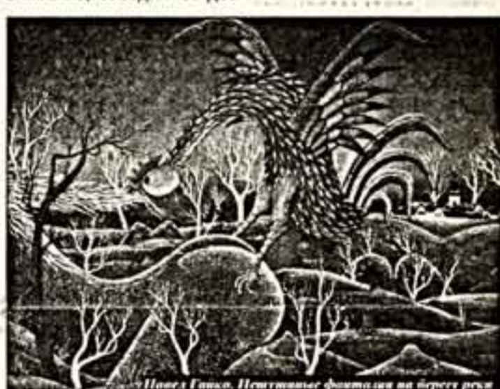
Петух и Лиса. Невостановимые фантазии на берегу реки

символами добра и зла стали петух и лиса. В жизни и творчестве он не пуританин и придерживается послоничья, что "курица несется только тогда, когда у нее есть петух". Естественно, что его петухи попадают в самые разные ситуации, и художник всепо рассказывает об этом. Их обоих, как вы обратили внимание, объединяют доб-