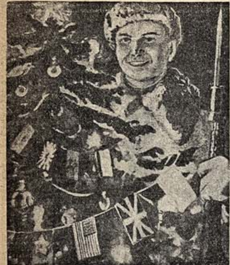
Плакат А. Кожоркина, вымученный к Новому году издательством «Искусство»