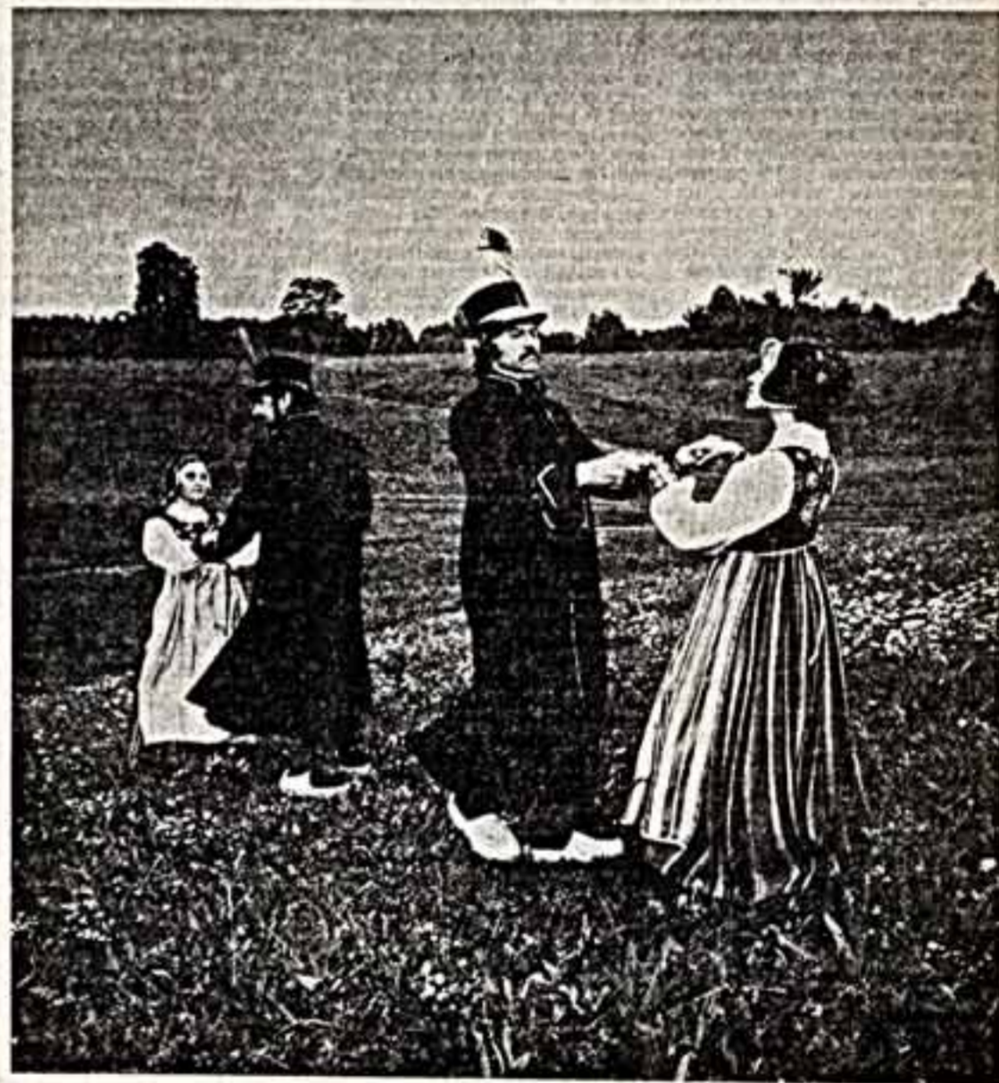
М. БАРАНОВСКИЙ. «Старинный литовский танец».