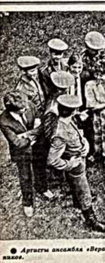
Артисты ансамбля «Вереск» в гостях у воинов-десантников.

УКАЗ Президиума Верховного Совета СССР О награждении литературно-художественного журнала «Советская Гейланд»