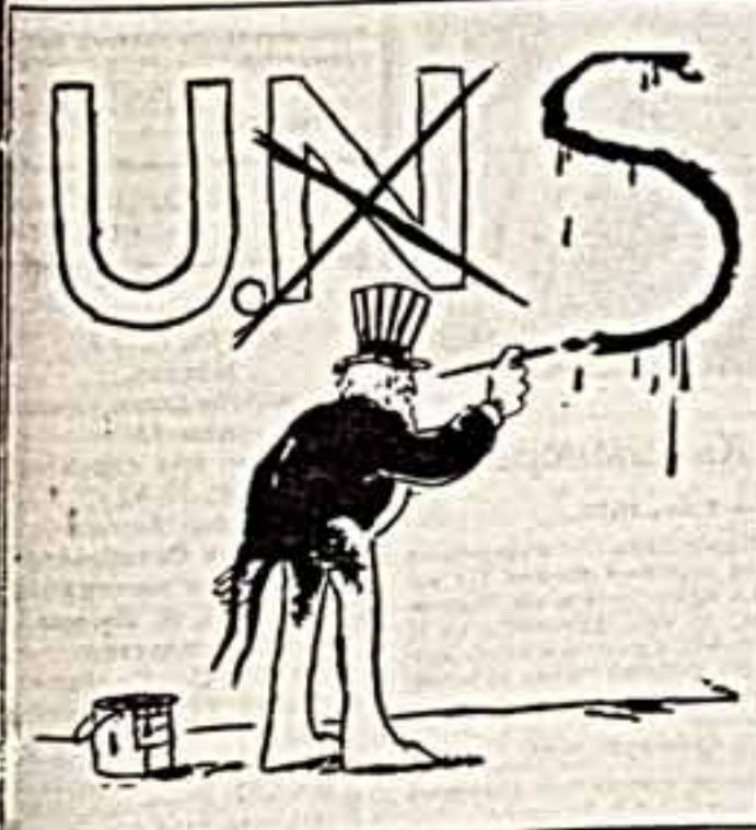
Официальный Вашингтон продолжает нажимать наладку в отношении Организации Объединенных Наций. Одно из последних свидетельств тому — публикация в газете 41-й сессии Генеральной Ассамблеи ООН Доклада президента и американскому парламенту о деятельности «Картинки будущего», в котором говорится о необходимости «привнести в сотрудничество с интересами США решения ООН по ключевым проблемам современности».