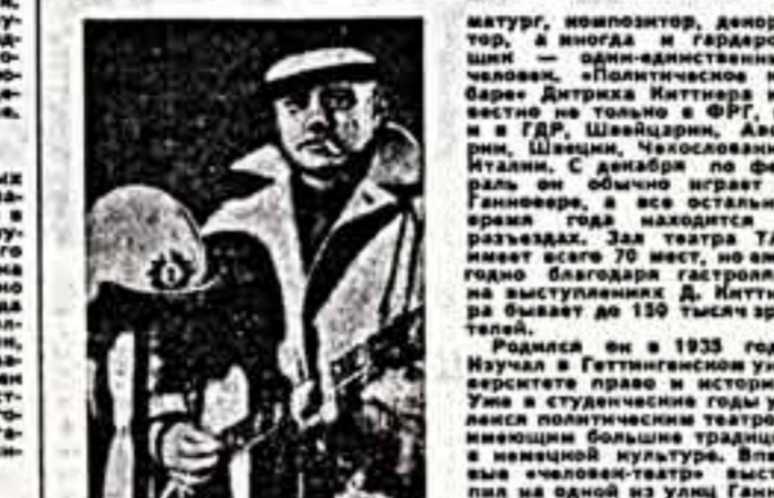
В главном городе земли Нижняя Саксония — Ганновер — это район Вулф...