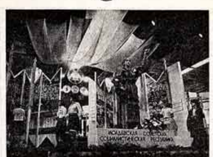
В Москве, на ВДНХ СССР, продолжается работу выставка «В семье единой, отражающая достижения советских социалистических республик за годы Советской власти».

Далеко за пределами родного края известны многие коллективы, выступавшие в тот вечер на сцене Театра оперы Кузбасса: ансамбль танца Дворца культуры шахтеров Кемерова «Шагреневские оленки», академический хор Кемеровского университета, мужской хор клуба производственного объединения «Кузбассэлектромотор». Поставил И. Лихову удалось представить в концертных номерах все основные профессии индустриального Кузбасса — шахтеров, металлургов, химиков, строителей.