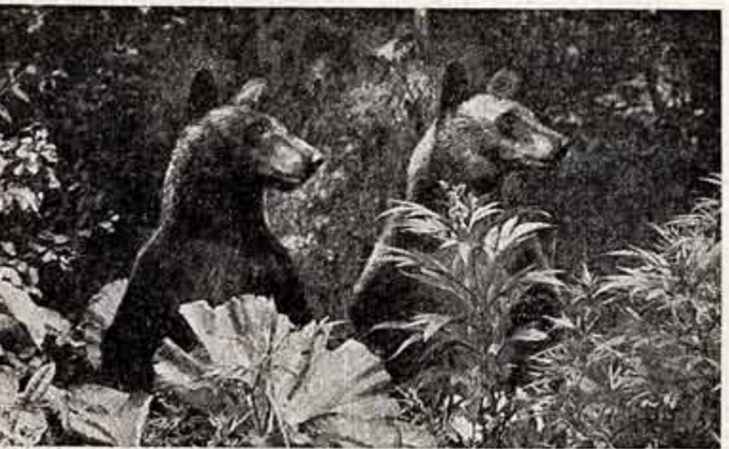
В. ОРЛОВ. «Блаженны». «Полдень на Куншаре».