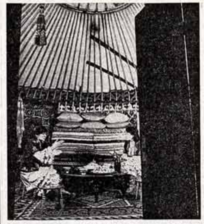
Экспозиция МХМММ СССР. В районе Кузбасской ССР. Экспонаты РСФСР.