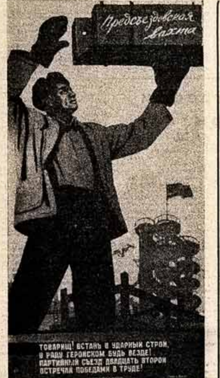
Планет художника Конст. Иванова. Стили А. Шарова. Московская мастерская агитплаката.

1961 ГОД 14 МАРТА ВТОРНИК № 31 (1211) Цена 3 коп.