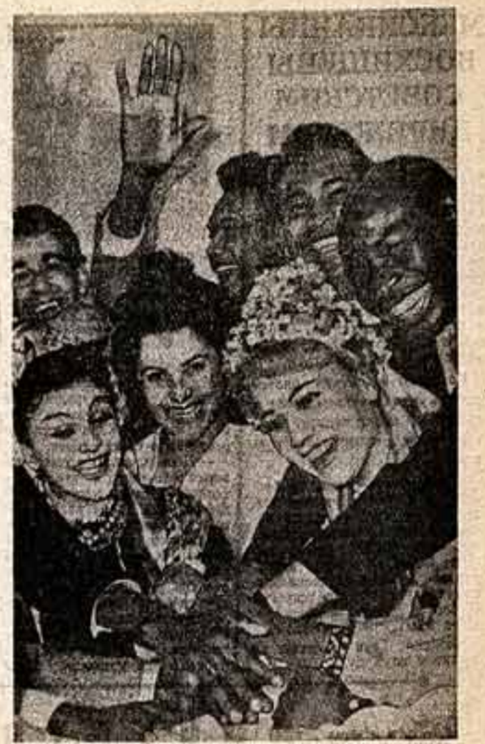
На снимке участники эстрадного представления «Эстафета друзей».