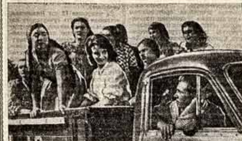
Кишиневская студия «Молдова-фильм» ведет съемку первого молдавского художественного фильма «Ранняя черешня». У молдавских кинематографистов накопился немалый опыт производства хроникальных черно-белых и цветных фильмов. И вот сейчас творческий коллектив молодой студии дает своеобразный экзамен на зрелость в жанре художественной кинематографии. Фильм «Ранняя черешня»

Неподдающемуся клубу издается несколько предприятий, у которых нет своих очков культуры. Можно ли оставаться равнодушным к такому факту? Не пора ли сделать рабочие клубы межфирменными, межзаводскими? Это открыло бы перед нами широчайшие возможности. В былые времена клубы могли получать художественную самостоятельность. В ее ряды войдут новые силы с новыми возможностями, которые до сих пор не имеют возможности пригласить руководителей клубов, или там нет на это ни сил, ни средств. А участники художественной самостоятельности производственных коллективов думают о том, чтобы систематически, круглыми годами совершенствовать свои способности. Разве мы не можем помочь им осуществить их скромную мечту? Разве не в силах сделать искусственные перегородки и