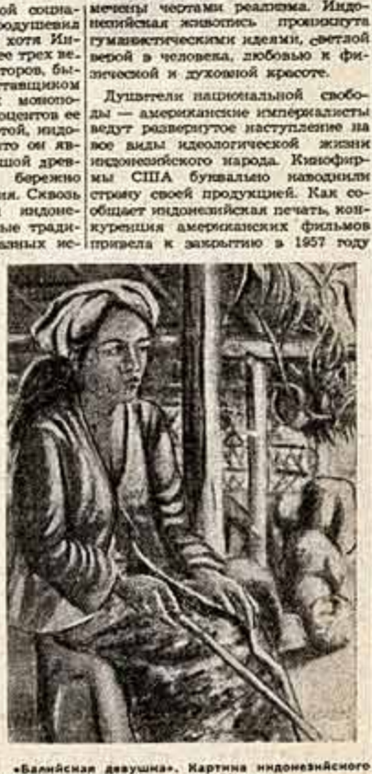
«Балийская девушка». Картина индонезийского художника Дженга Динамарина. Масло.