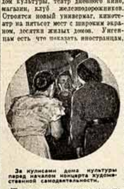
За кулисами дома культуры перед началом концерта художественной самодеятельности.