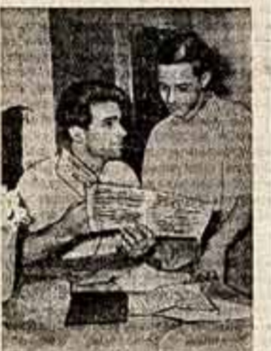
Жизнь реалистическая, чувства и мысли простого человека.