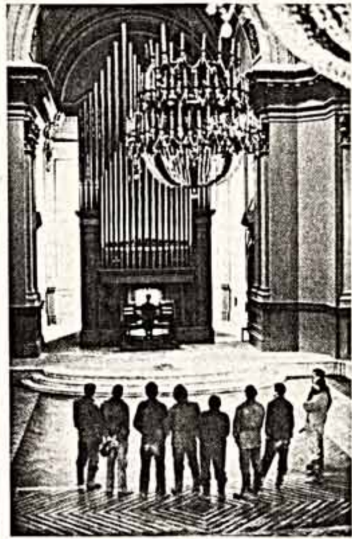
В конце минувшего года в городе Сузун, в отреставрированном здании Троицкого собора, специалистами старшей в Европе чехословацкой фирмы «Регер-Клосс» смонтирован новый орган. А в эти дни чехословацкие специалисты заканчивают монтаж органа в концертном зале комплекса речного вокзала города Волгограда. Уже идет интонировка-настройка музыкального инструмента, созданного специалистами одного из старейших предприятий в Европе. После завершения настройки органа, приемы его специалистами концертный зал на 1.100 зрителей будет открыт.

Печать, радио, телевидение непрерывно приносят сейчас сообщения о новых и новых оперных и концертных премьерах его сочинений в самых различных странах, о