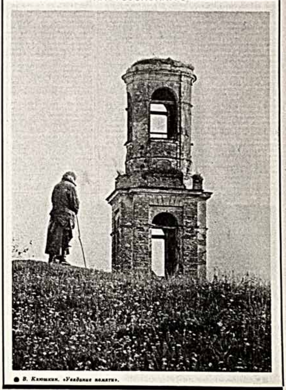
В. Кашкин. «Убеждение памяти».