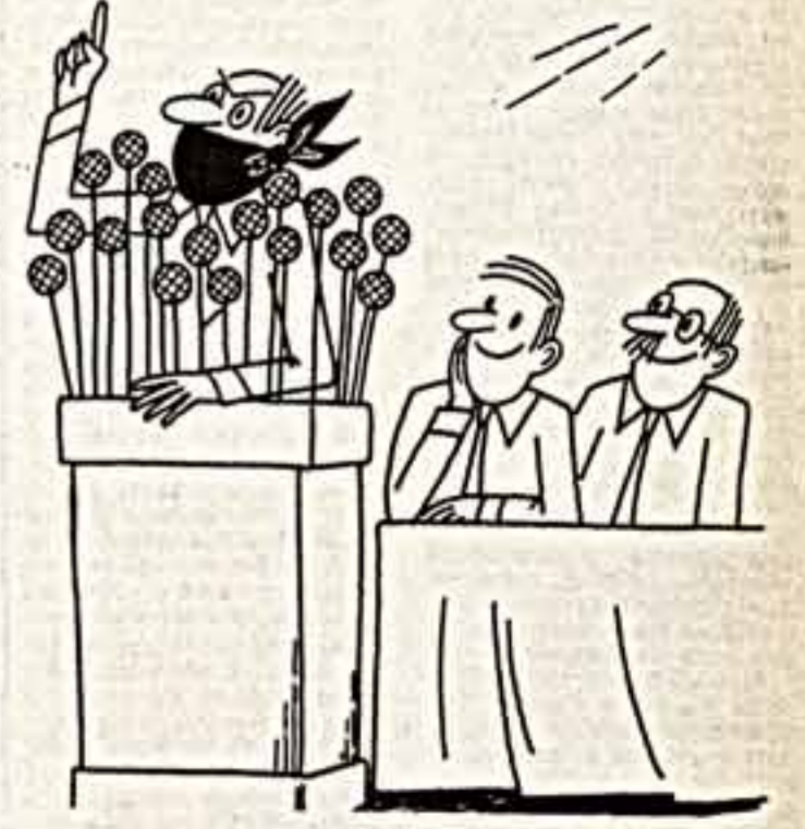
Ах, микрофоны, микрофоны...

Нарисовав ужасную картину — все западноевропейские сквоэнья-дмухановские и натовские лялкийи-тялкийи