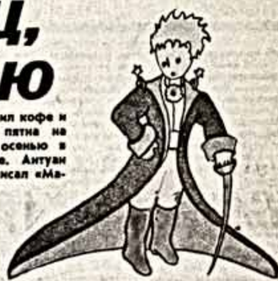
© Сент-Экзюпери. Маленький принц. А. Давид.

тал на свой манер: много курил, пил кофе и кока-колу. Об этом свидетельствуют пятна на оригинале, который будет выставлен осенью в Моргановской библиотеке в Нью-Йорке. Антуан де Сент-Экзюпери ночью 1942 года писал «Маленького принца».