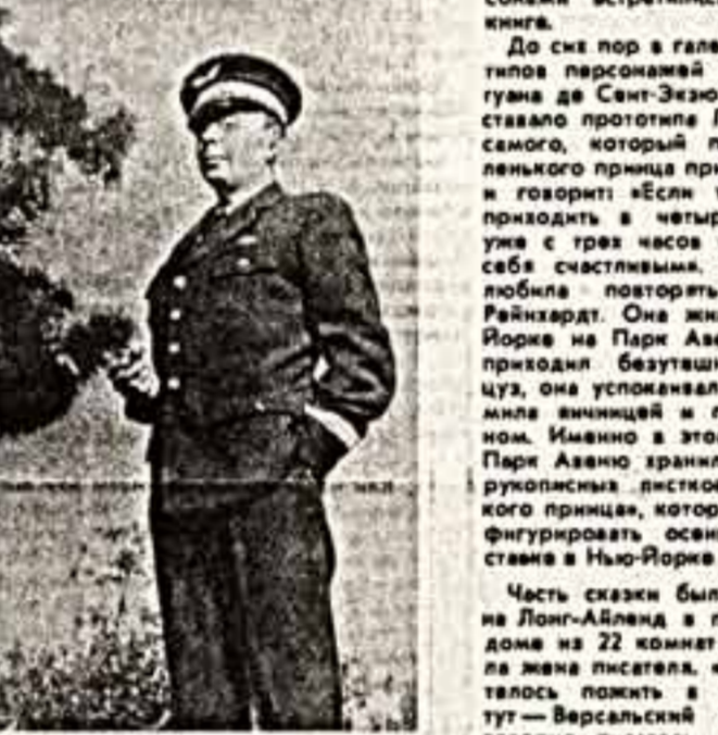
Жена писателя Консуэло. Антуан де Сент-Экзюпери. Тулуза, 1939 г.