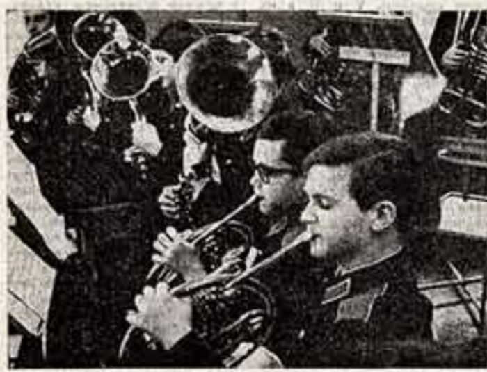
Военные парады на Красной площади открывает и заканчивает по традиции тысячерукий сводный духовой оркестр. На военной музыке, о которой еще А. В. Суворов говорил, что она удаляет, утрачивает силу армии, звучит не только по праздникам. Стреловая песня, марш — неразлучные спутники советского воина в походе и на отдыхе.

А. ПЕТРОВ. Играют воспитанники Московской военно-музыкальной школы.