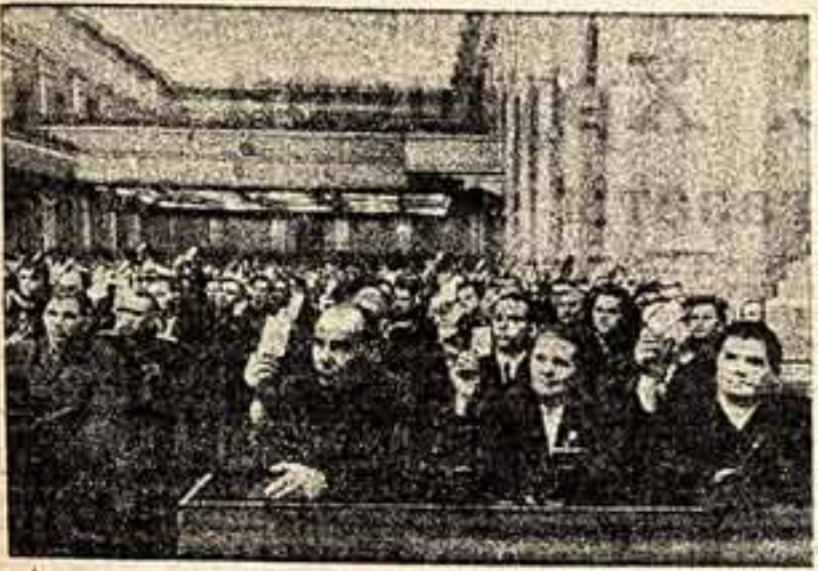
14 февраля 1956 года в Кремле открылся XX съезд Коммунистической партии Советского Союза. На снимке: делегаты съезда единогласно голосуют за принятие Постановления об отчетном докладе Первого секретаря ЦК КПСС товарища Н. С. Хрущева...