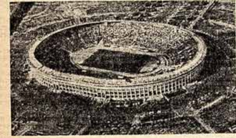
Советские спортсмены получили замечательный подарок — Центральный стадион имени В. И. Ленина.