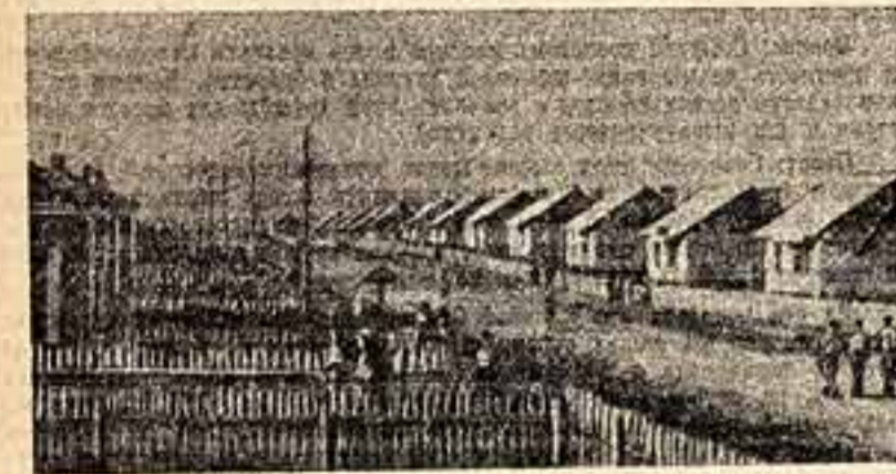
Труженики совхоза «Комсомолец» Чкаловской области собрали свой первый урожай. На снимке: посев совхоза. Еще недавно здесь была нетронутая новильная степь...