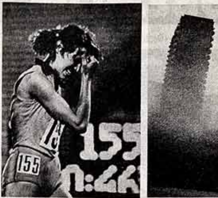
С. ГУНДЕР. «Неудача».