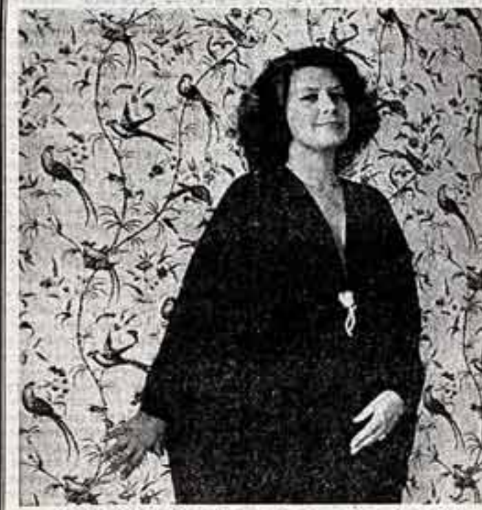
В. МАЛЫШЕВА. Народная артистка СССР Елена Образцова.