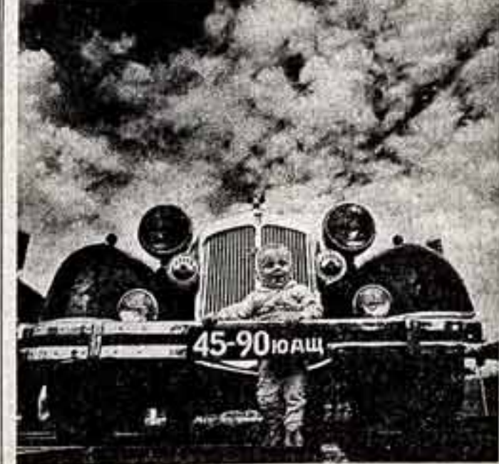
Б. САВЕЛЬЕВ. «Старый автомобиль».