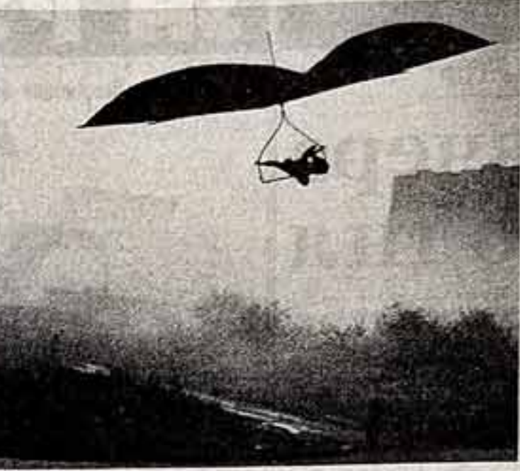
С. КОСТРОМИН. «Выжидательная позиция».