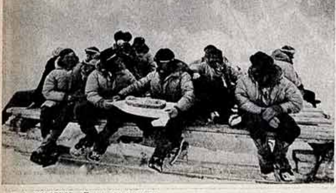
В. ЧИСТЯКОВ. «Покорители полярности».