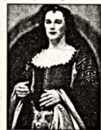
Справа: Марк Райлонс. Слева: в роли Клеопатры