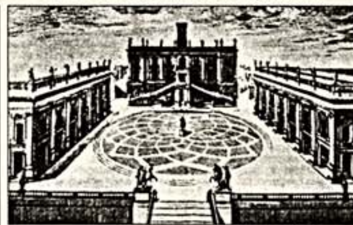
Дюперак. "Капитолий". Гравюра

21 апреля "столице мира" и Венскому городу Риму исполняется 2723 года. К этой дате Государственный музей изобразительных искусств имени А.С.Пушкина устроил выставку "Прогулки по Риму". Портрет города в произведении итальянского художника XVIII века. Живопись, гравюра, рисунок, ювелирные украшения ГМИИ им. А.С.Пушкина и Российской государственной библиотеки.