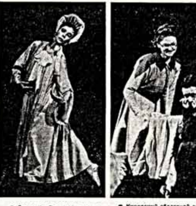
Солстка Большого театра Союза ССР, народная артистка РСФСР И. Сорина впервые исполнила партию Незнакомки в балете «Эскизы» А. Шнитке.