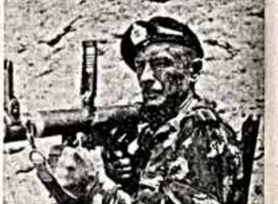
Народный артист РСФСР М. Ножкин в фильме «Одинокое плавание».

И мысленно всегда будут петь на Владимирском — здесь они прижизненно.