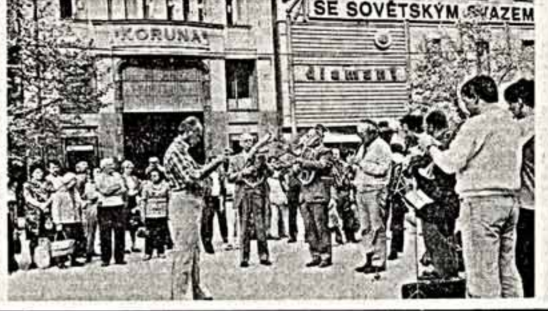
Энрих Гофман, Герой Советского Союза