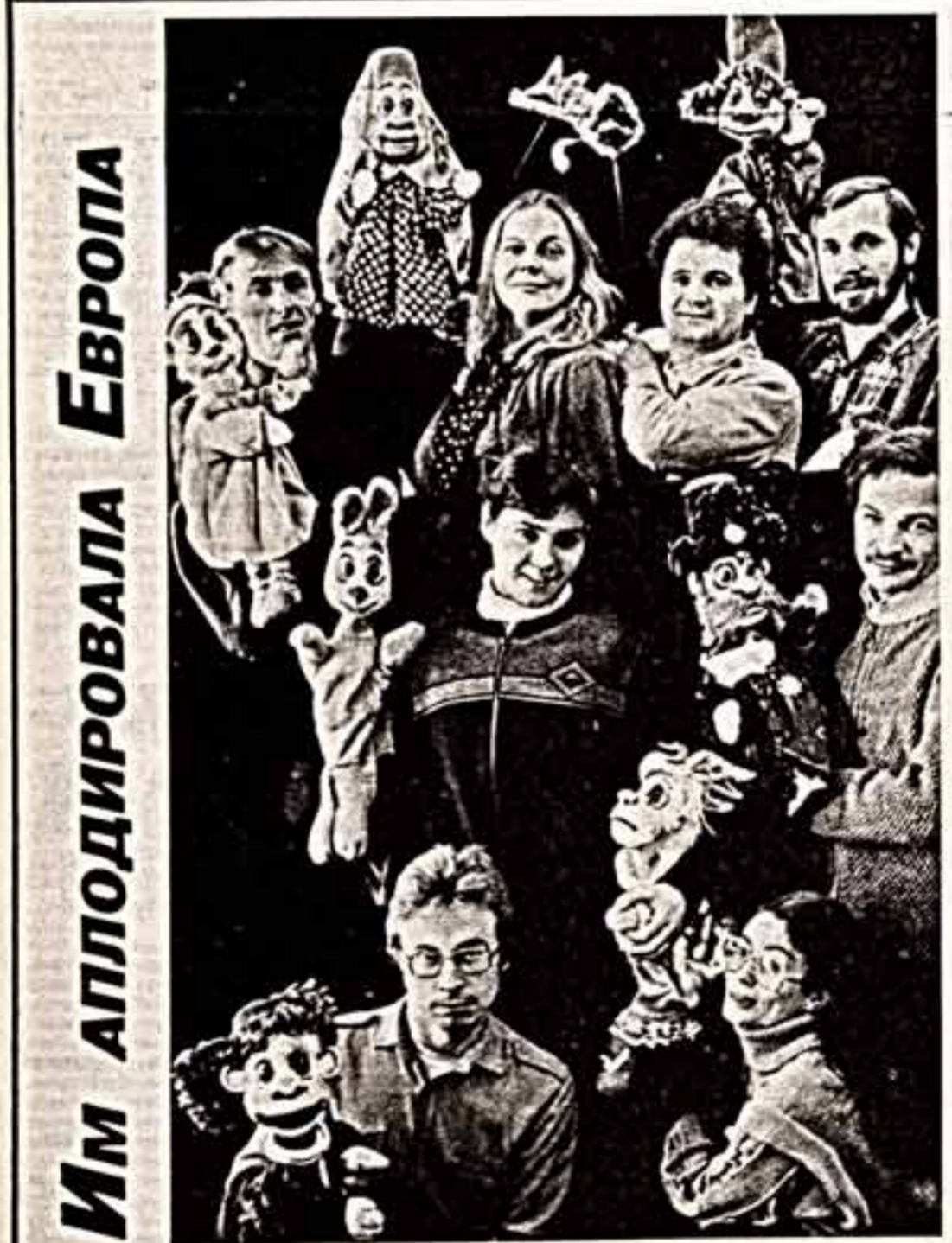
Им апплодировала Европа