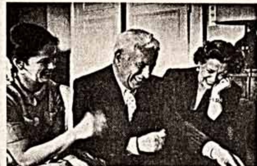
Таким его знают все.

Этот снимок был сделан кинорежиссером Г. Александровым в Вене, Чаплим с женой Уной и чародной артисткой СССР Любовью Орловой.