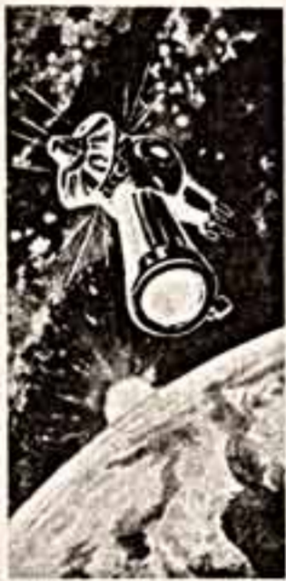
А. А. Леонов