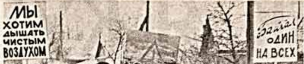
Эта печальная история началась почти три десятилетия назад, когда строился десятиэтажный гигант Буртин — Салавтинский цинково-магнетитный комбинат. А руда Салавга — основная водная артерия, питающая Байкал. Победа строителей, сдавших комбинат в промышленную эксплуатацию, оборнулась бедой. Дым накрыл село Бранск сплошной удушливой интартой и интартой, нефтепродукты и другие органические соединения.

Волнует меня и существующее пока вмешательство в творческий процесс. Я считаю, что слушатель, широкая публика, люди искусства должны быть главными ценителями созданных произведений.