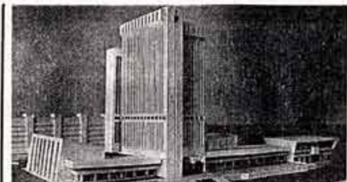
Стоит подняться на ближайшие склоны гор, и Алма-Ата предстанет перед вами во всем своем великолепии...