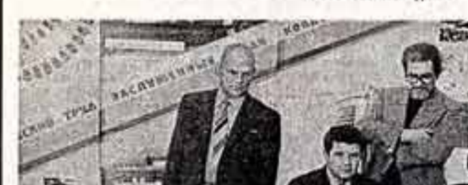
В центре экспозиции — восьмилетнее собрание сочинений «Ленинским курсом»...