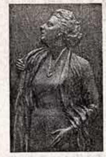
Фрагмент памятника А. К. Тарасовой, фото Н. Самойлова.

Представители театральной общественности, предприниматели, деятели культуры, родные и друзья собрались в минувшую пятницу на Введенском клубе в Москве. Здесь состоялось торжественное открытие памятника А. Тарасовой. Монумент выполнен из бронзы в виде стелы — с родной артистки СССР Константина Тераскина саванной красавицы страны из истории отечественного театра. За более чем полвековое служение Московскому Академическому театру имени М. Горького А. Тарасова создала галерею ярких образов русских женщин. Миллионам зрителей широко известны роли, сыгранные ею в кино.