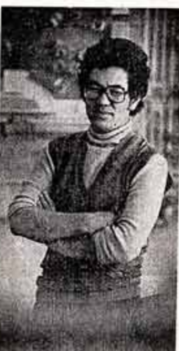
Вал встреч писатель Анатолий Алексин.