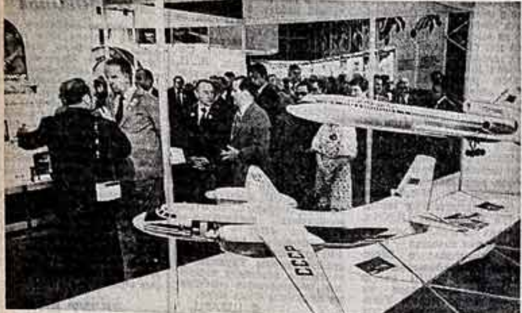
Польша. 51-я Международная вокальская ярмарка. В центре — вымпелы специалистов, деловых людей, трудящихся в составе Польши — вымпел Советского Союза.