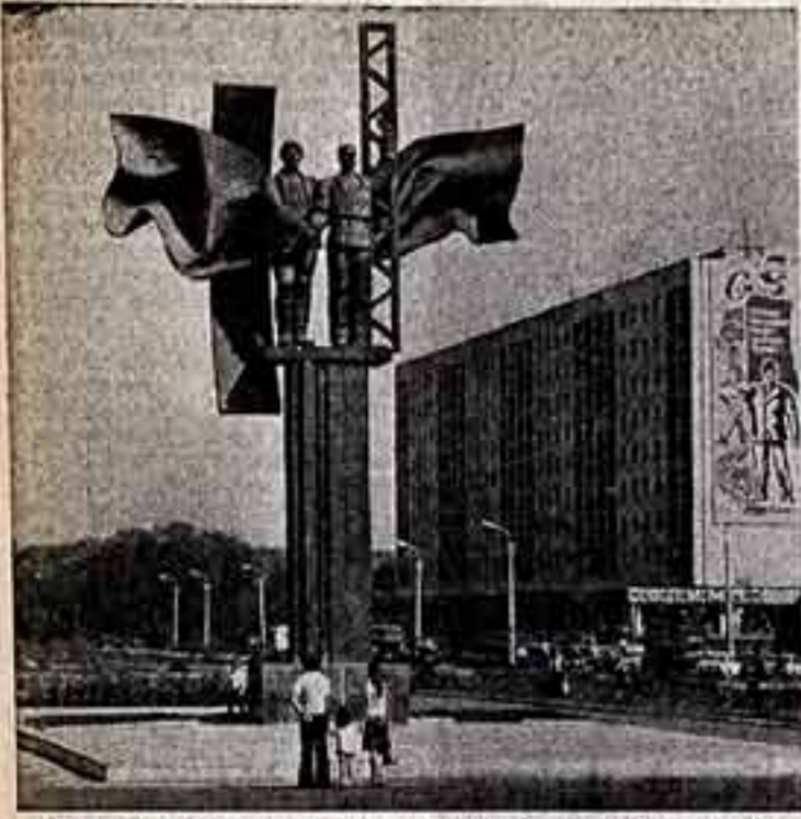
Олимпийский электрометаллургический комбинат — один из многих объектов в стране, сооружаемых при участии специалистов из братской Болгарии. Памятник советским и болгарским строителям сооружен на проспекте Дружбы в городе Старый Осло. Авторы — скульпторы С. Герасимов, А. Бурганов и архитектор С. Феоктистов.