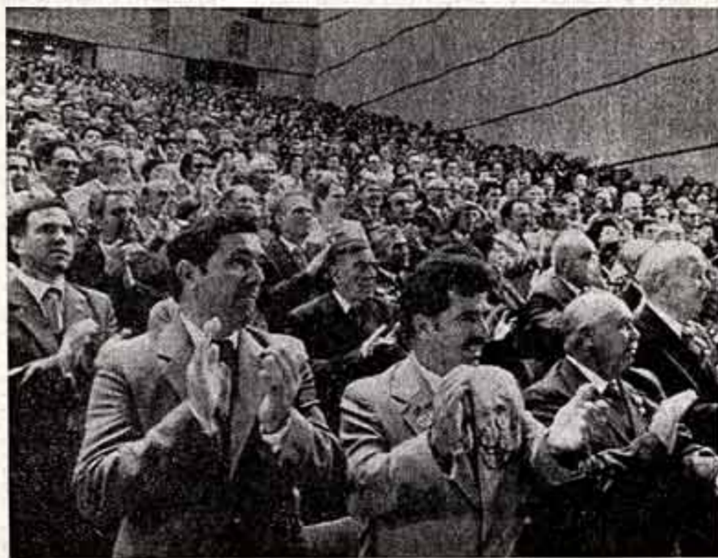
Торжественное заседание в Баку. На трибуне — Л. И. Брежнев.