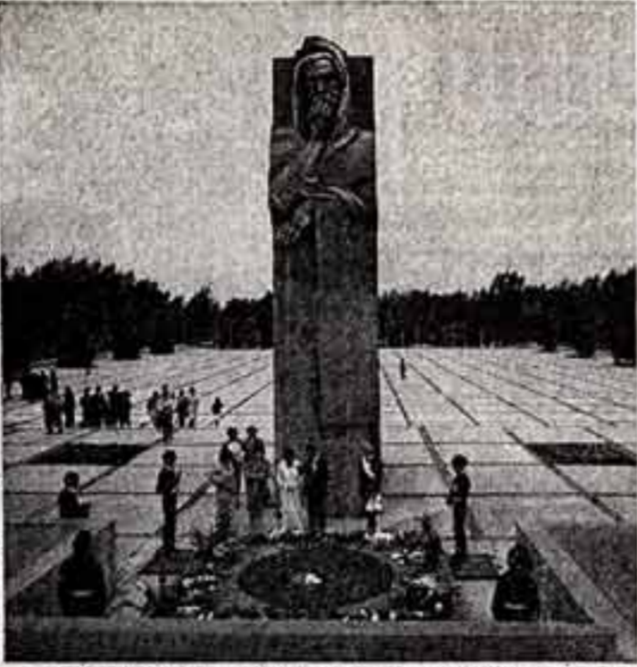
Монумент Славы воинско-сибирским воинам в Новосибирске. Он состоит из символической статуи скорбящей женщины-матери, вечного огня и семи мощных десятиметровых пилонов, на которых выгравированы имена 39 286 новосибирских павших на фронтах Великой Отечественной войны. Автор памятника А. Чернобровец.