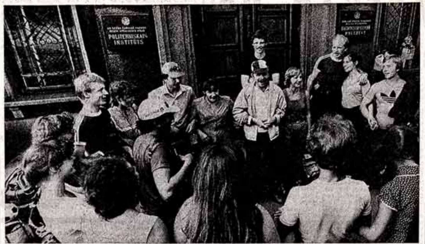
Четверть века дарит радость людям студенческой танцевальной ансамбль «Вантоса» Римского политехнического института. Недавно этому талантливому коллективу присвоено почетное звание — народный. Искусство студентов хорошо знают не только в Латвии, но и далеко за ее пределами.

В соххозе-комбинате имени 50-летия СССР эту систему усвоили хорошо. К услугам работников животноводческого комплекса отличная столовая, ассортимент блюд которой можно только позавидовать, комнаты отдыха, душевые. На центральной усадьбе, в селе Яновлевском, — универсальный магазин, парикмахерская, Дом быта.