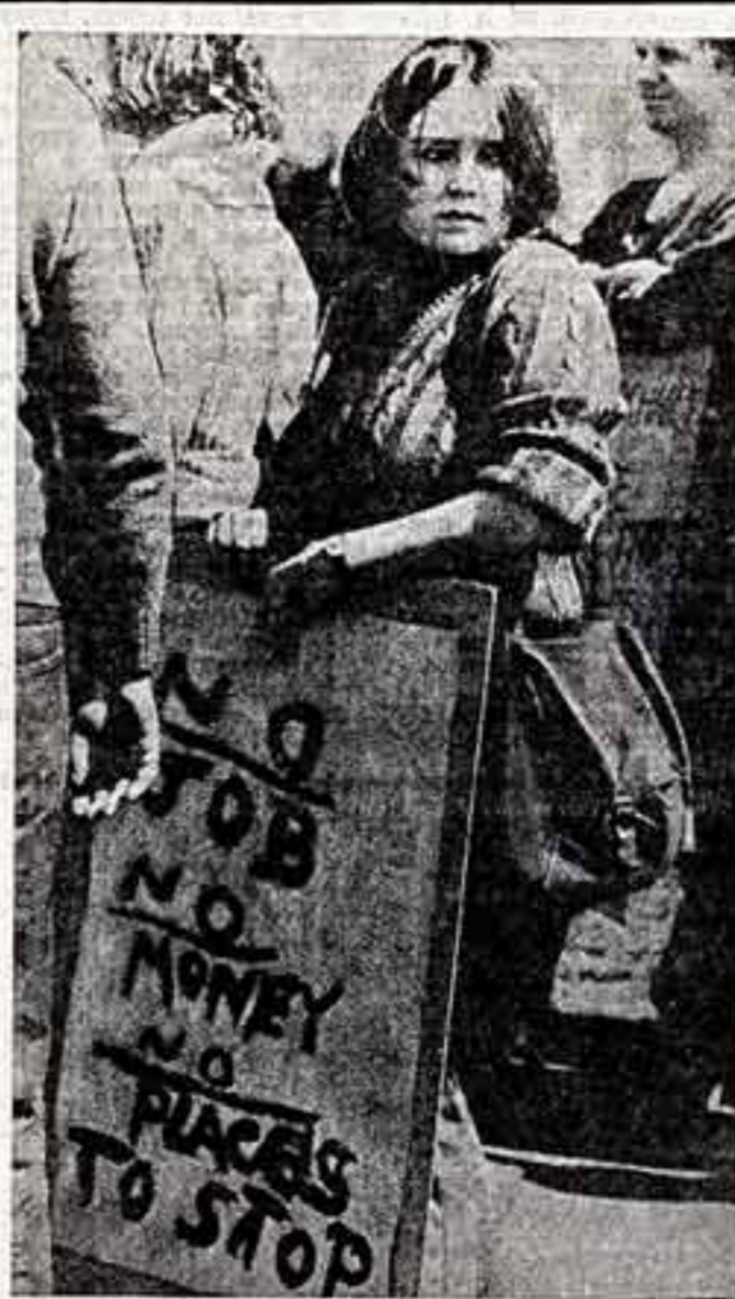
Беспрецедентное наращивание вооружений, антигуманная политика, проводимая нынешней администрацией Великобритании... Беспрецедентное наращивание вооружений, антигуманная политика...