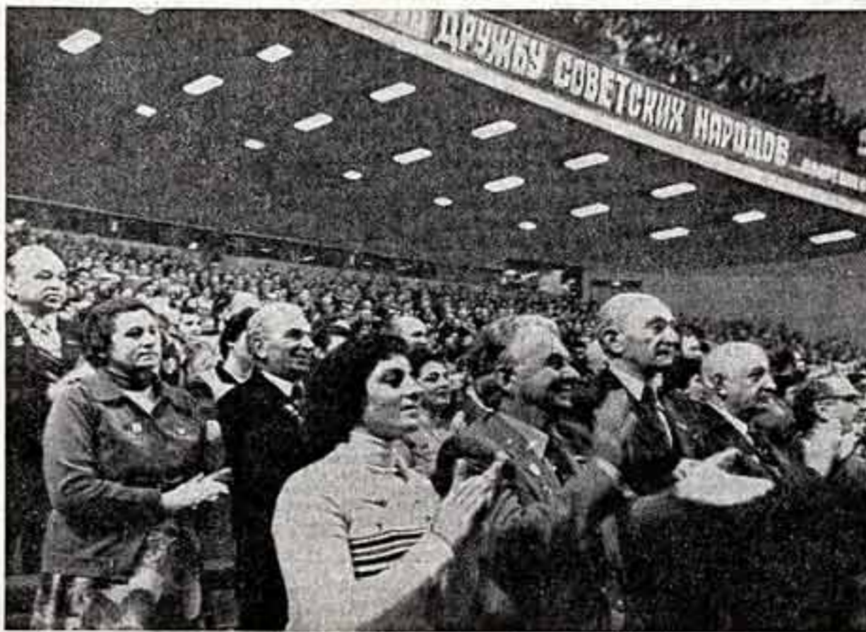
Торжественное заседание в Тбилиси. На трибуне — товарищ Л. И. Брежнев.

Ваш самый желанный и самый почетный гость, наш дорогой Леонид Ильич Брежнев, который несмотря на огромную занятость важнейшими партийными и государственными делами, решил на время отложить все, чтобы принять участие в этих торжествах.