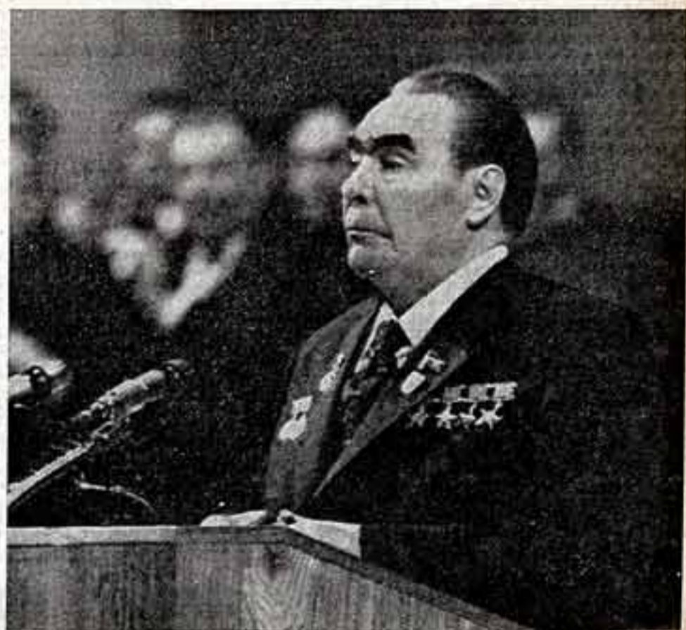
Телефон А. Пахомова и Б. Соколова («Правда»)