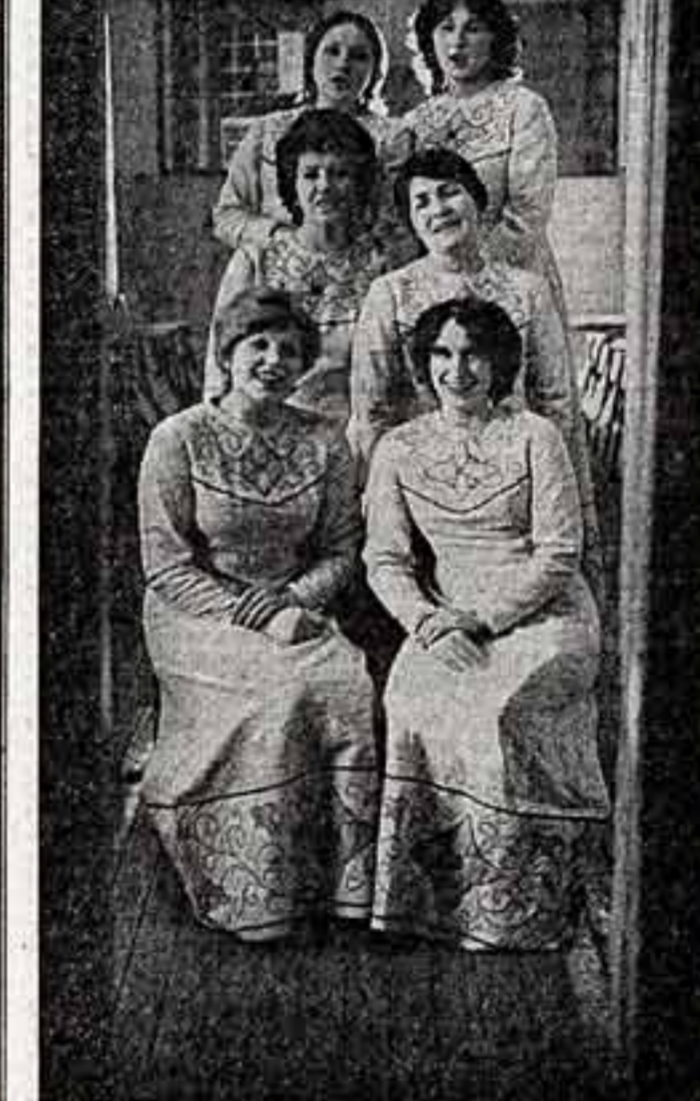
Концерты участников художественной самодеятельности союза «Первороссский» Восточно-Казахстанской области нежно тепло принимались односельчанами.