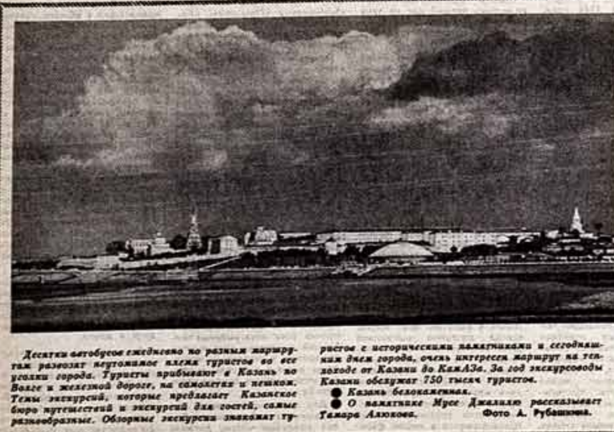
Детишки автобусов счастливо на разных маршрутах развозят потравленное алмаз горное во все уголки города. Угнетает приближает в Казань во все время и в жилах дороги, но сажает в и нежало. Тем же картинкой, которые предвещают Казанские берега иттистей и экскурсий для детей, самые разнообразные. Обширные экскурсии знаят тр...