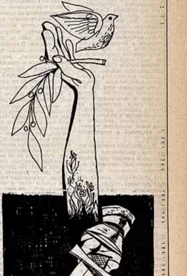
Восторгается мир! Рисунок художника А. Рефремы [США] специально для «Советской культуры».

Великая ответственность за это лежит на нас — людях искусства.