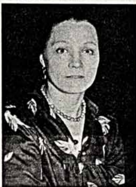
благодарной и неприхотливой аудитории. В основном здесь были женщины, что рождает атмосферу разговор на равных, о том, что они понимают с полуслова и полужелудка...

Каждая счастливая актриса судьба по-своему несчастлива. Не видите в этом парадокса: не о парадоксальности и оригинальности суждения пексь. Просто опыт наблюдения за многими актрисами биографиями подсказывает, что внешне благополучная судьба в искусстве таит в себе и великое множество симптомов неблагоприятия.