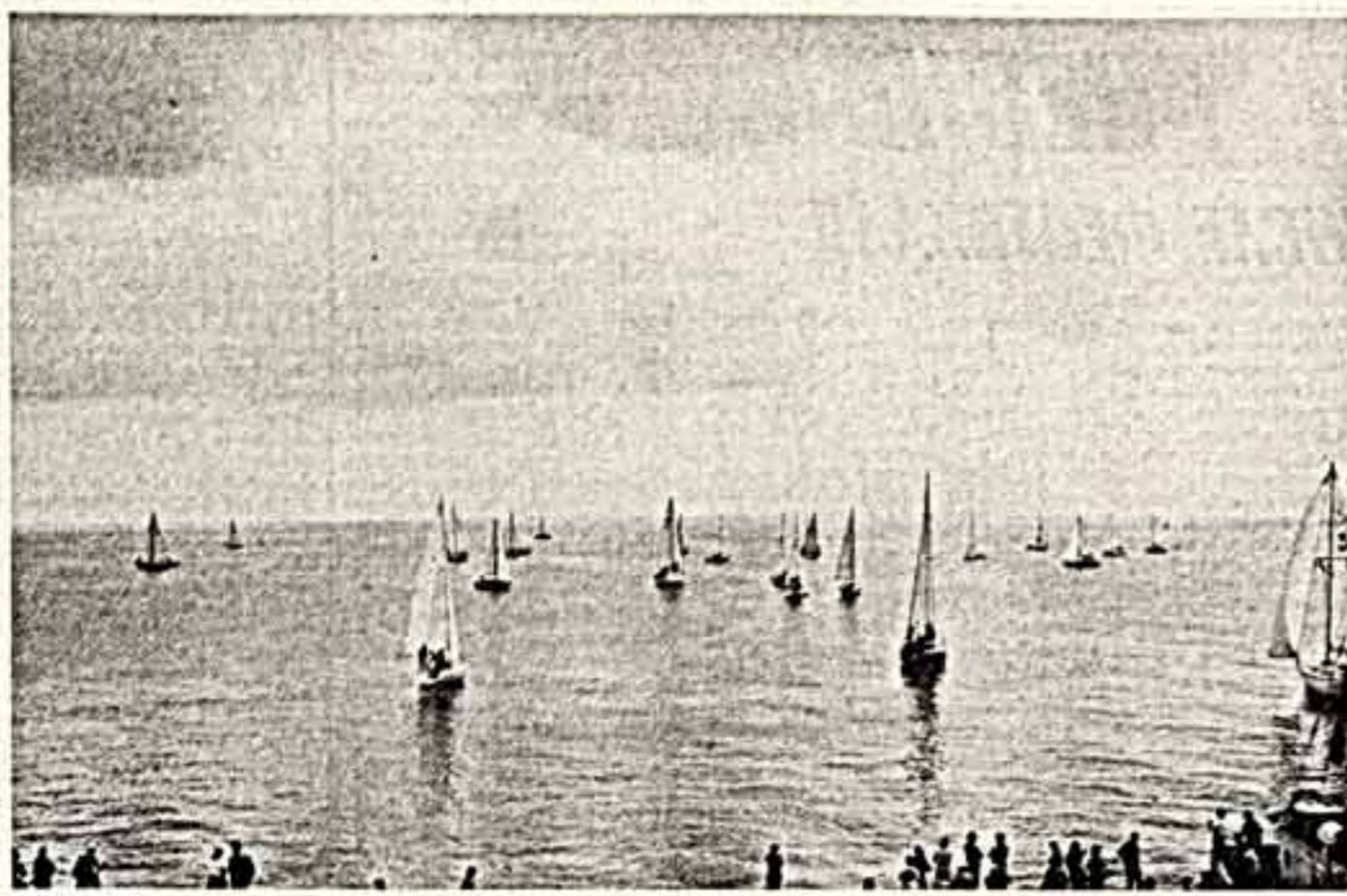
ФОТОКОНКУРС • Ж. МИЗГРИС. «В Перизме регата».

В. АЖАЖА, художник, Пяритин, Латвийская область.