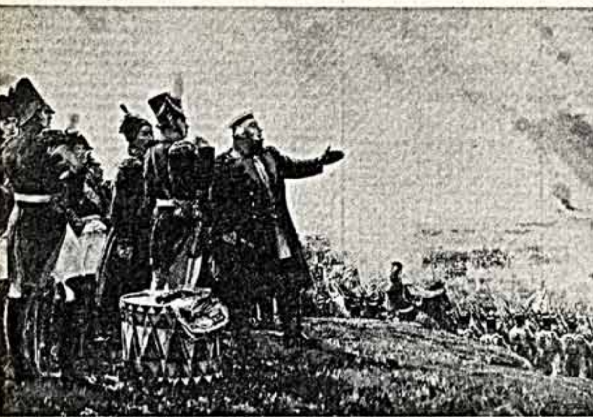
С. ГЕРАСИМОВ. «Кутузов под Бородино».

стало всматриваться в лица, полные воинственной отваги. В стихотворении «Полководец» поэт писал: «Толпой тасмою тудомкиа вместили мачальники мародии нивши сил. Покрыты славою чудесного поезда И вечной памятию двенадцатого года.»