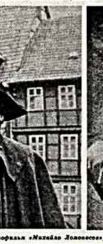
Беседу вел Е. ЧЕКАЛОВА.