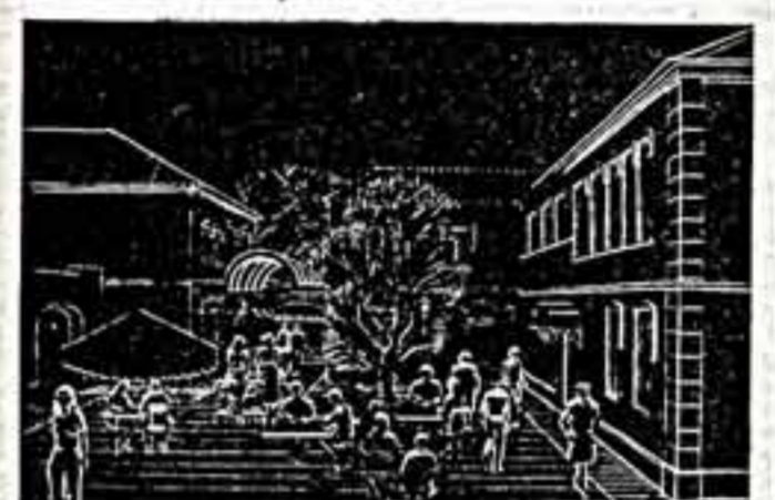
Фрагменты проекта реконструкции улиц Вологодской.