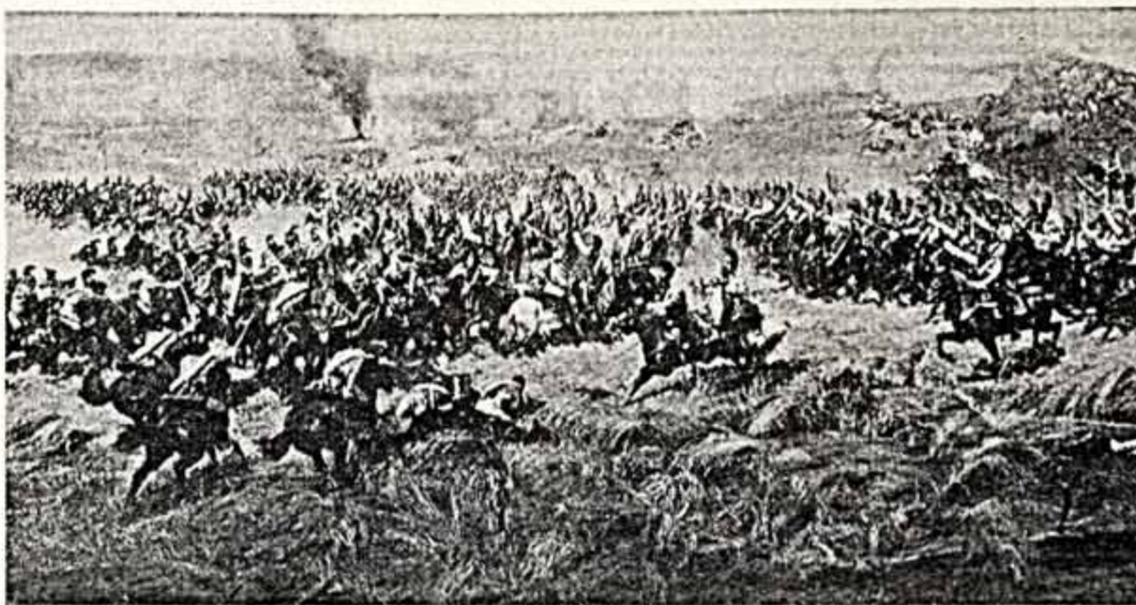
Ф. РУБОВ. «Панорама «Бородинская битва» (фрагмент)».