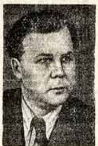
Александр Трифонович ТВАРДОВСКИЙ