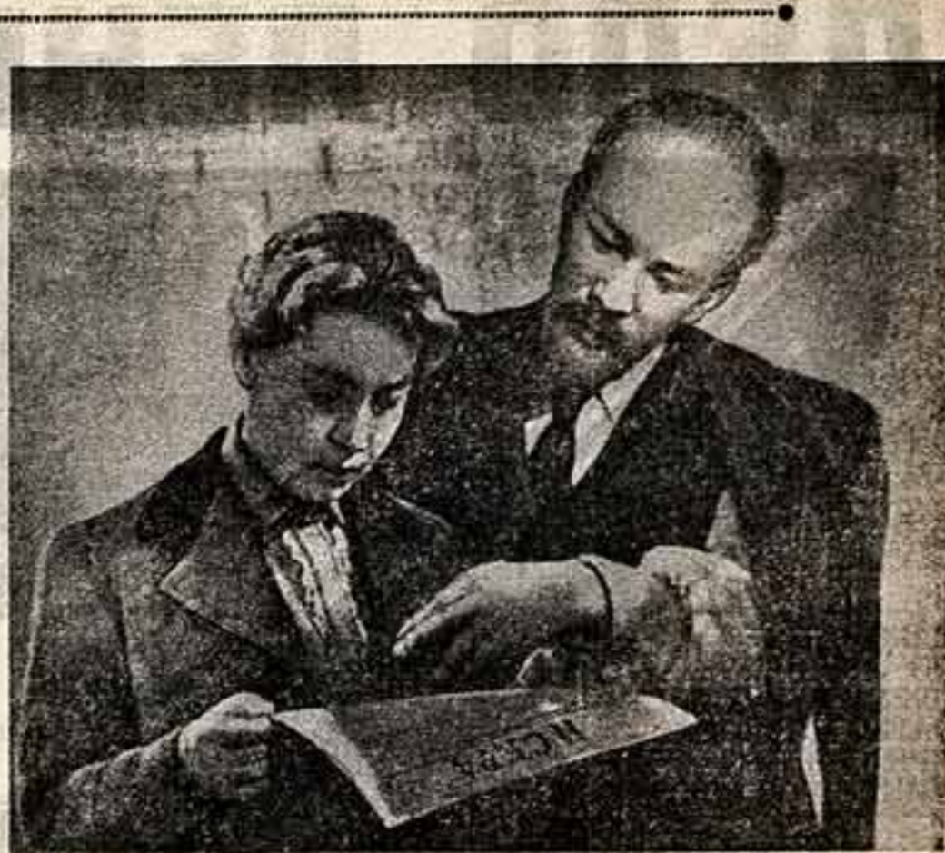
Кадр из фильма «В начале века»

Выполняя заветы великого Ленина, партия ведет нашу страну к торжеству коммунизма. Политика нашей родной Коммунистической партии, все ее деятельности направлены на создание материально-технической базы коммунизма, развития и совершенствование общественных отношений, воспитание человека коммунистического будущего, упрочение мира и укрепление мировой социалистической системы.