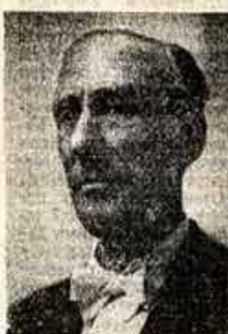
Евгений Александрович МРАВНИНСКИЙ