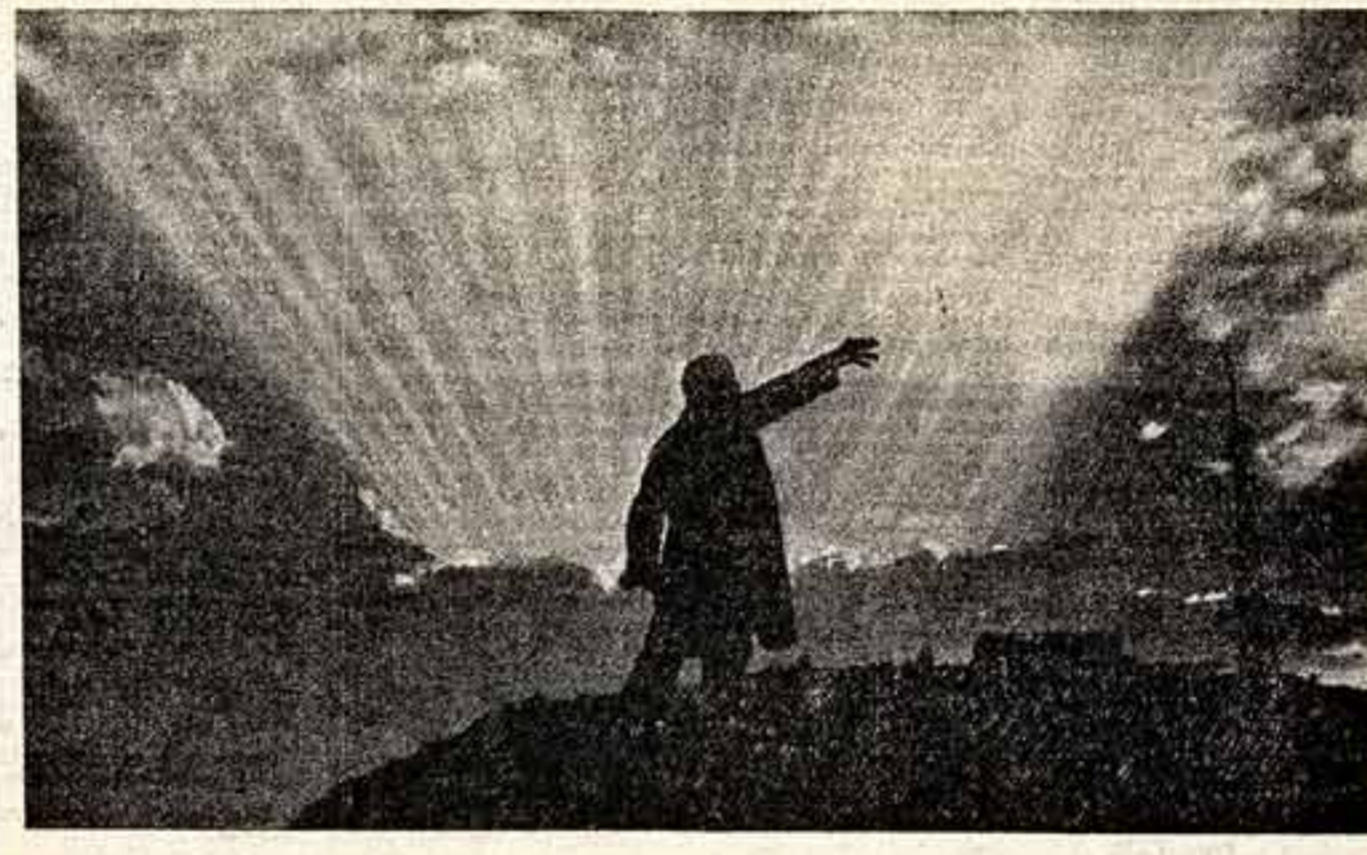
СВЕТОЧ КОММУНИЗМА. Фоторабота Т. АРЧУАДЗЕ («Семиплетня в действии», 1961).

торам, графикам нашей страны, прогрессивным художникам всего мира. В них учителя и ученики писали: «Мы убеждены, что только человек, глубоко и тонко чувствующий и понимающий искусство, имеет право называться строителем нового мира. Мы убеждены, что именно люди труда, строители коммунистического общества, являются лучшими наследниками великого богатства человечества. Так учит Ленин». Мы считаем, что у нас со школьниками нет необходимости овладевать этим богатством. Вот почему у нас родилась мысль о создании в нашей школе культурный памятник Ильичу — картину, которая бы выходила за рамки простого школьного музея. Она стала бы одной из самых интересных достопримечательностей нашего города, родины В. И. Ленина. Ее посетит тысяча людей, — ведь ежегодно нашу школу посещают тысячи иностранцев со всех концов страны и из-за рубежа». Но, конечно же, создание нашей галереи невозможно без добровольной, бескорыстной помощи самих художников. Вот почему мы решили обратиться к писателям, скульпторам, графикам Советского Союза, и прогрессивным художникам всего мира с просьбой принять участие в создании такой галереи на родине Ильича». Мы верим, что вы не откажетесь принять участие в этом благородном деле». На обращении коллектив школы имени В. И. Ленина уже откликнулись художники Е. Кибрич, Н. Жуков, Д. Набильдин, А. Мищенко и другие. К. СМЕРНОВ, УЛЬЯНОВСК.