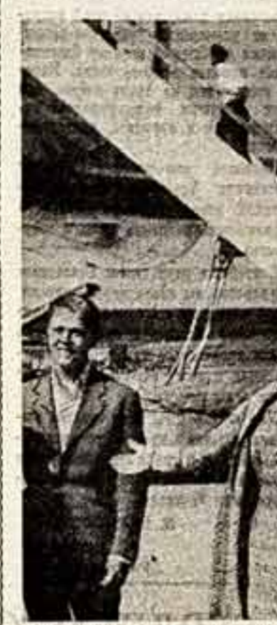
Известный советский кинорежиссер Г. Александров ставит на киностудии «Мосфильм» новый фильм «Русский сувенир». Он посвящается проблеме сочувствия между народами, советским людям, которые не словами, а делом доказывают, что они хотят дружбы и мира, а не войны.

По сюжету фильма его герои — группа иностранцев — совершают большое путешествие по Советскому Союзу от озера Байкал до Москвы. Во время этого путешествия они видят перемены Ангары в районе строительства Братской гидроэлектростанции, новые заводы, фабрики Сибири, присутствуют при запуске ракет в космос.