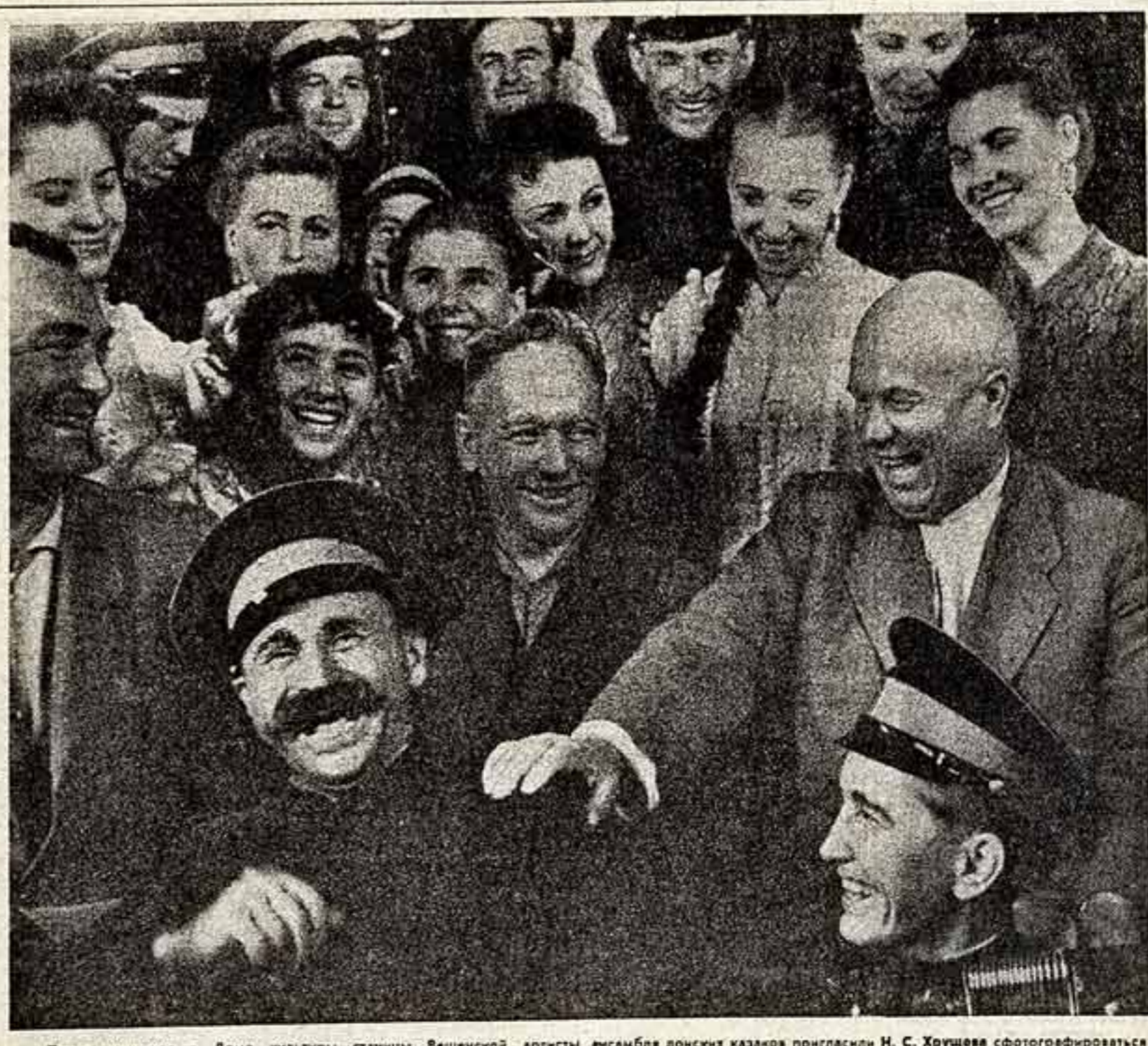
После концерта в Дома культуры станицы Вешенской артисты ансамбля донских казаков пригласили Н. С. Хрущева сфотографироваться вместе с их знаменитым земляком М. А. Шолоховым.

И В ДАЛЕКОЙ Японии, и в Индиях, и в Соединенных Штатах, когда заходит речь о советской литературе, обычно первый вопрос бьет о Михаиле Шолохове. «В Мельбурне один австралиец сказал мне: «Наверное, Шолохов живет в центре Москвы — на горе, да? И ему виден весь мир, да?»