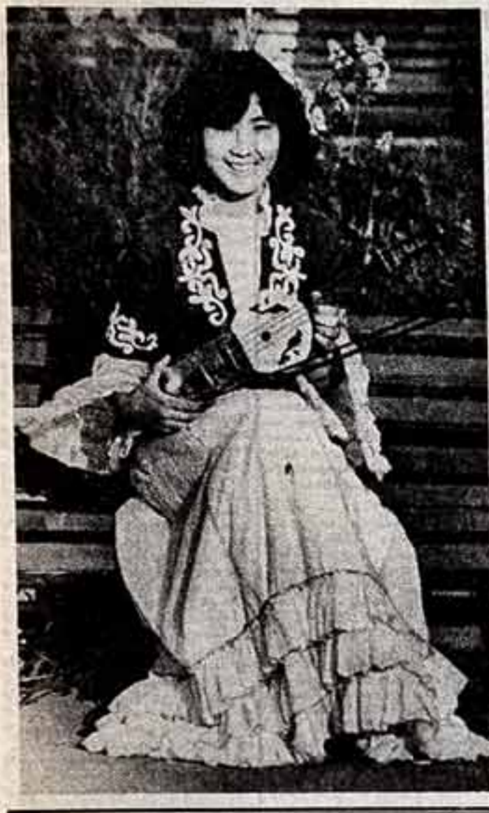
Ансамбль песни и танца Алтын-Гули городского дома культуры «Алтын-Гули» существует уже второй год, но участники его уже успели побывать во всех уголках обширной жемчужинной области — в стропилах.

На республиканском смотре коллективы ансамбля стали лауреатами и ему присвоено звание народного.