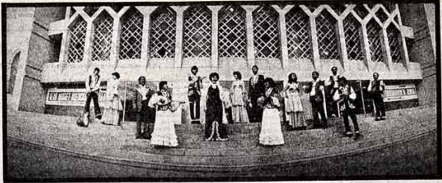
культура села: опыт, проблемы