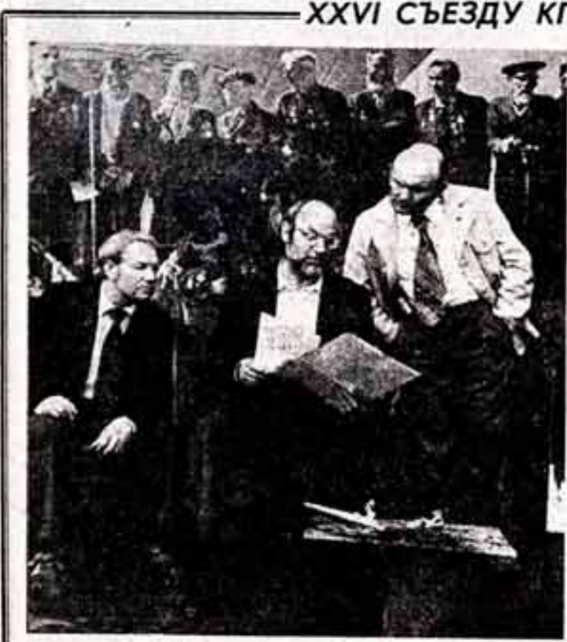
Подготовка к XXVI съезду КПСС стала повсеместно всенародным делом. Рабочие и колхозники, представители творческой интеллигенции...