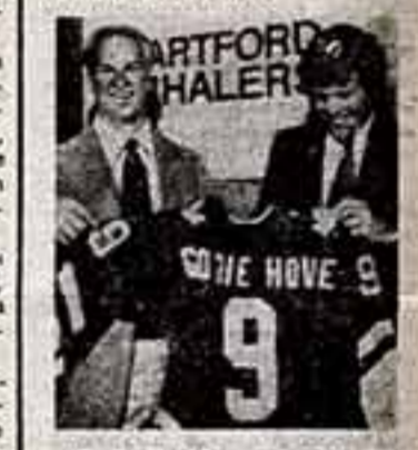
Горди Хоу во время торжественной церемонии расставания со спортом. Фото из журнала «Ньюсвик».