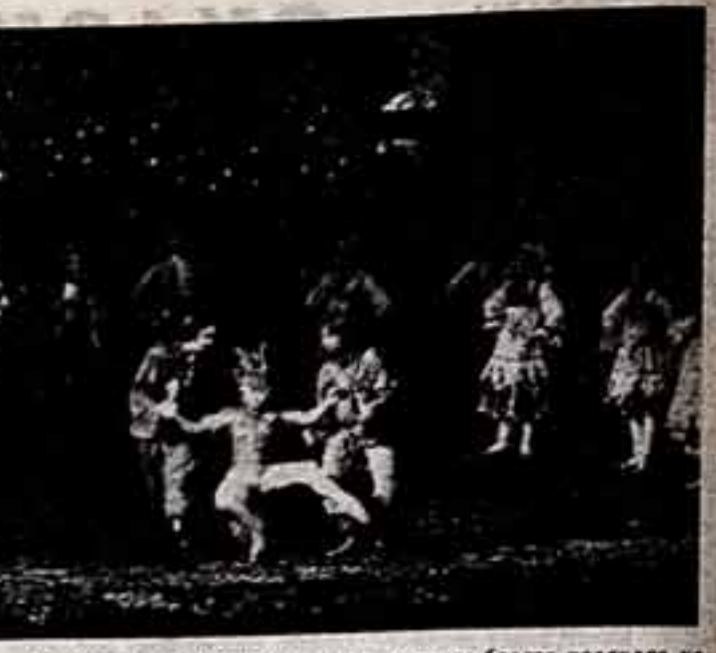
В репертуаре Одесского театра оперы и балета новоявилась новая спектакль — балет Р. Шедрика «Король-Горбунок» (по мотивам одноименной сказки П. Ершова). Постановка в хореографии Н. Рыжикова и В. Смирнова-Голованова.

«Среди обелисков, Вокруг деревьев — как в скверике. Место людно. Играно дето. Не место смерти, а торжествующая жизнь. Город достиг его своим извратным, скверным, седым, насмертным, извратным торжествующим городом. Исполнивший и в самых жестоких испытании, доставшихся ему на долю на наших глазах, нашей памяти, знает своего поэта: