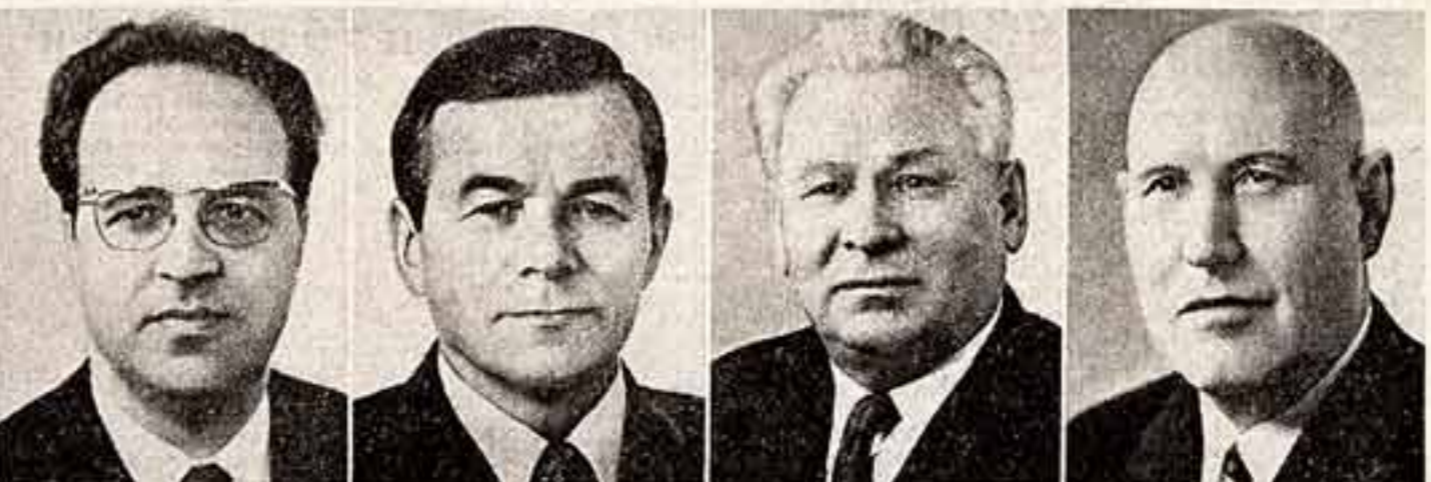
И. В. Капитонов. Секретарь ЦК КПСС. В. И. Долгих. Секретарь ЦК КПСС. К. Ф. Катушев. Секретарь ЦК КПСС. М. В. Зимьянин. Секретарь ЦК КПСС. К. У. Черненко. Секретарь ЦК КПСС. Г. Ф. Сизов. Председатель Центральной ревизионной комиссии КПСС.