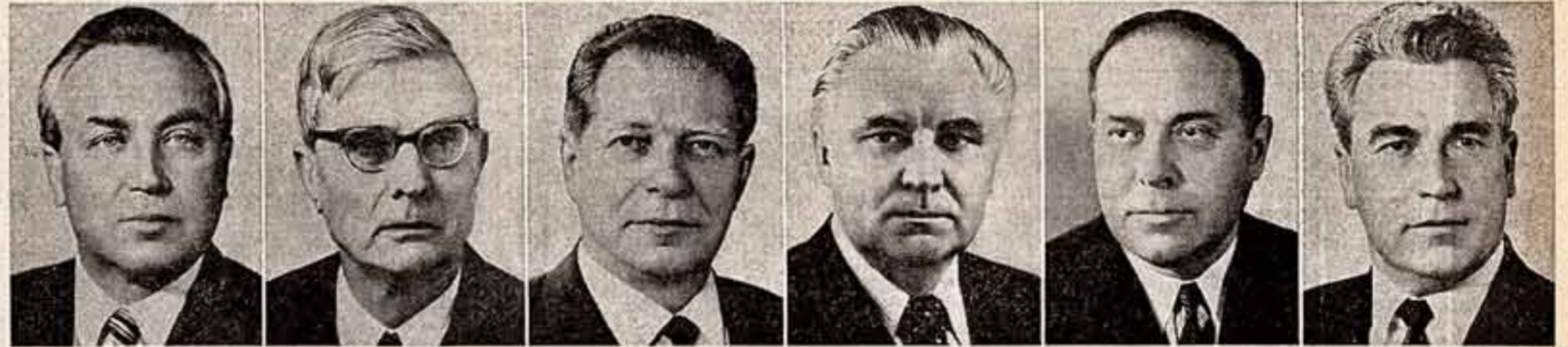
Г. В. Романов. Член Политбюро ЦК КПСС. М. А. Сулов. Член Политбюро ЦК КПСС, секретарь ЦК КПСС. Д. Ф. Устинов. Член Политбюро ЦК КПСС, секретарь ЦК КПСС. В. В. Щербцкий. Член Политбюро ЦК КПСС. Г. А. Алиев. Кандидат в члены Политбюро ЦК КПСС. П. Н. Демичев. Кандидат в члены Политбюро ЦК КПСС.