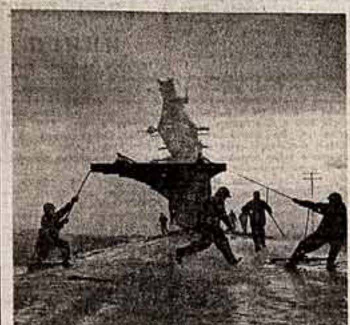
Широкий круг повседневных забот коммунистов — борьба за качественный, творческий труд, забота о духовном росте строителей коммунизма, мужество стремление быть там, где труднее. Обо всем этом рассказывают произведения лучших мастеров страны, представленные на Всесоюзной выставке, которая продолжает свою работу в Москве, в выставочном зале Дома художников.

МОРЯК СХОДИТ НА БЕРЕГ Улица Уус-Садама. Эстонское морское пароходство. 4 тысячи человек — пассажиров, 1.300 — коммунисты, 1.700 — комсомольцы. Многие молодые и много молодежи. Рейс 2—2,5 месяца, стоянка в порту — от недели до 15 дней, сменных экипажей почти нет. 250 человек участв. заочно. Все это достаточно ясно обрисовывает круг задач по вопросам культурного обслуживания моряков. Мы побывали на культурно-пароходства — небольшой, но весьма неплохо оснащенный. Здесь своя радиостудия: каждое судно берет в рейс от 16 до 20 перелетных (5—6 общественно-политических, остальные познавательные и развлекательные). Раз в три месяца выходит журнал, 47 тысяч томов насчитывает библиотека, но... Наши собеседники — заместитель секретаря партийного пароходства Анатолий Николаевич Михарев и старший методист культуры Нина Венедиктовна Рубанова — рассказывают: — Хронически не хватает художественной литературы, библиотечка снабжается через единственный на всю республику коллектор. А каждое судно должно