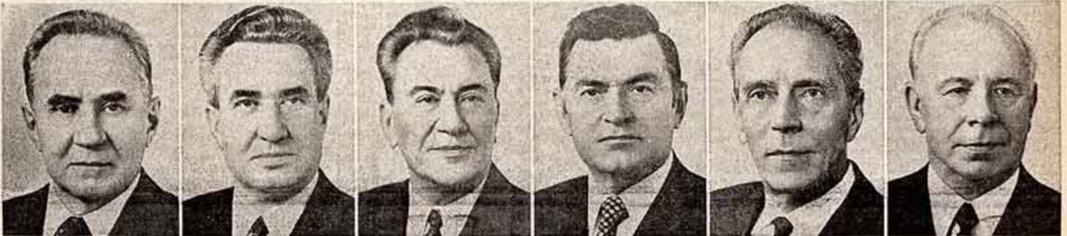
А. Н. Косыгин. Член Политбюро ЦК КПСС. Ф. Д. Кулаков. Член Политбюро ЦК КПСС, секретарь ЦК КПСС. Д. А. Кунаев. Член Политбюро ЦК КПСС. К. Т. Мазуров. Член Политбюро ЦК КПСС. А. Я. Пельше. Член Политбюро ЦК КПСС, председатель ЦКПК при ЦК КПСС. Н. В. Подгорный. Член Политбюро ЦК КПСС.