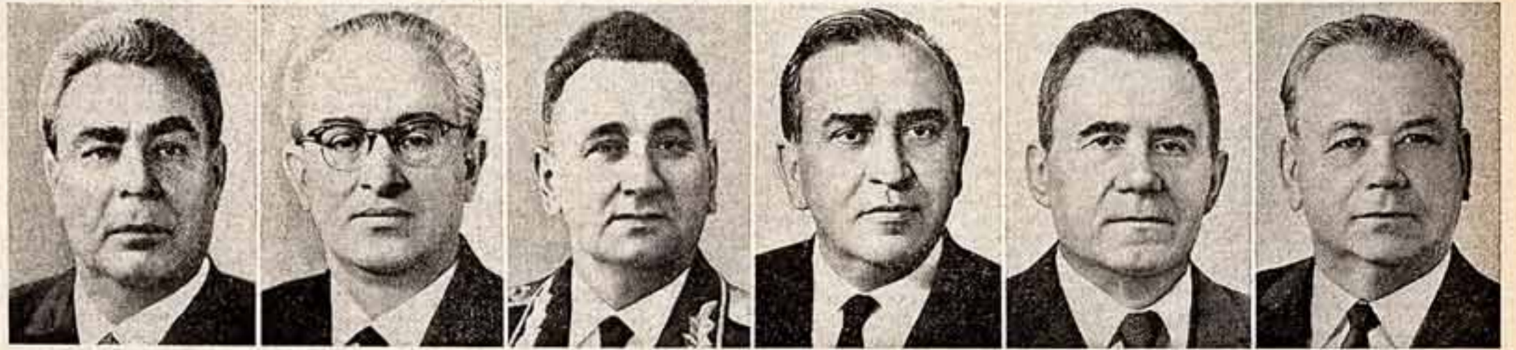
Л. И. Брежнев. Член Политбюро ЦК КПСС, Генеральный секретарь ЦК КПСС. Ю. В. Андропов. Член Политбюро ЦК КПСС. А. А. Громыко. Член Политбюро ЦК КПСС. В. В. Гришин. Член Политбюро ЦК КПСС. А. А. Громыко. Член Политбюро ЦК КПСС. А. П. Кирilenko. Член Политбюро ЦК КПСС, секретарь ЦК КПСС.