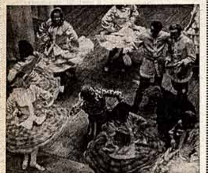
На сцене — самодеятельный ансамбль песни и пляски Ростовского районного дома культуры (Ярославская область).