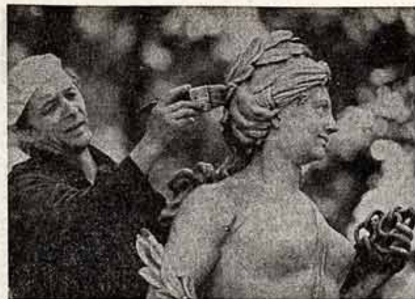
У любви много оттенков. Наиболее существенный из них — «Ради имени» — на экране. И действительно, чего не сделаешь ради имени?