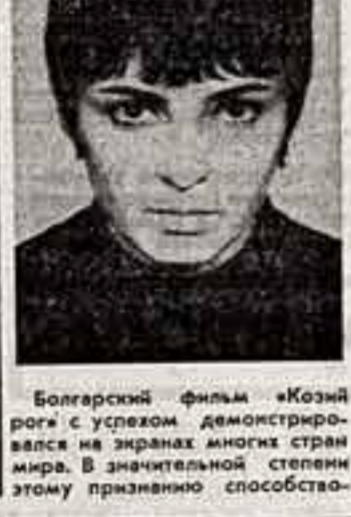
Болгарский фильм «Козий рог» с успехом демонстрировался на экранах многих стран...