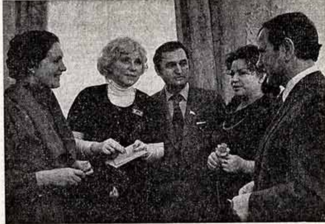
...нашей любимой Родины и высотам социально-экономического и духовного прогресса.