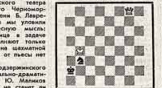
МАТ В 3 ХОДА Желез в шах решивший с пометкой «Шахмат» конкурс (желательно за открыткой) в течение 10 дней со дня опубликования.

Последовал второй вопрос. Да, они не потеряли шансов на успех, если начнут и сегодня. Ответ на предыдущее задание (по итогам эвентуальной аналитико-интегральной работы киевлянина О. Турченко): задача О. Немо решается 1. Кр3; 1. Кр2; 2. Фd2-1.