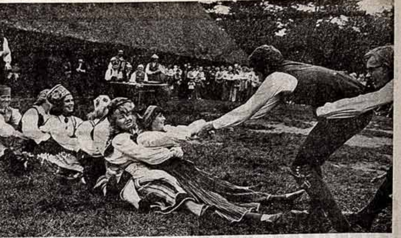
ФОТОКОНКУРС В. АХОМОВ, Урал Победы

В нынешнем году наш народ будет отмечать знаменательную дату — 60 лет образования Советских Социалистических Республик. Исходя из постановления ЦК КПСС о 60-й годовщине образования СССР, Совету журналистов, всем его организациям нужно незамедлительно определить свое участие в подготовке и проведении этого знаменательного события, разработать соответствующие мероприятия, оканчивая творческую работу редакционных коллек-