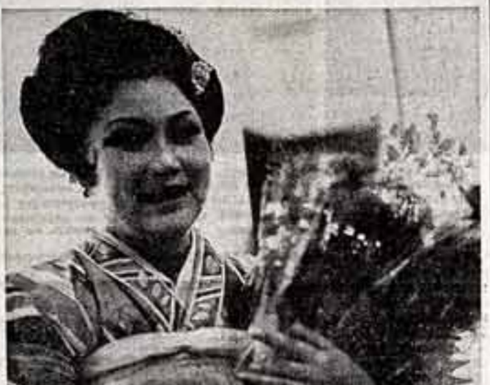
Также русской и мировой классики.