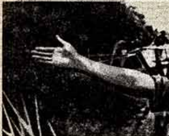
Южный Вьетнам. Кинооператор на фронте.