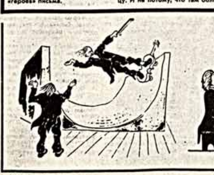
Рисунки Ю. Самарина, В. Федотова и П. Машалева.

Вопрос, поднятый нашим постоянным автором и читателем, уходит корнями в глубокую древность. Еще античные философы спорили о месте встречи человека и животного. И не все были согласны. Но в наше время этот вопрос приобретает особую актуальность. Ведь мы живем в эпоху, когда границы между искусством и жизнью становятся все более размытыми. И это заставляет нас задуматься о том, где именно происходит встреча искусства и зрителя. И можно ли ее изменить? Ответ на этот вопрос зависит от многих факторов: от таланта артиста, от качества постановки, от готовности зрителя воспринять новое. Но, безусловно, место встречи можно и нужно изменять. Это требует усилий и творчества со стороны всех участников процесса.