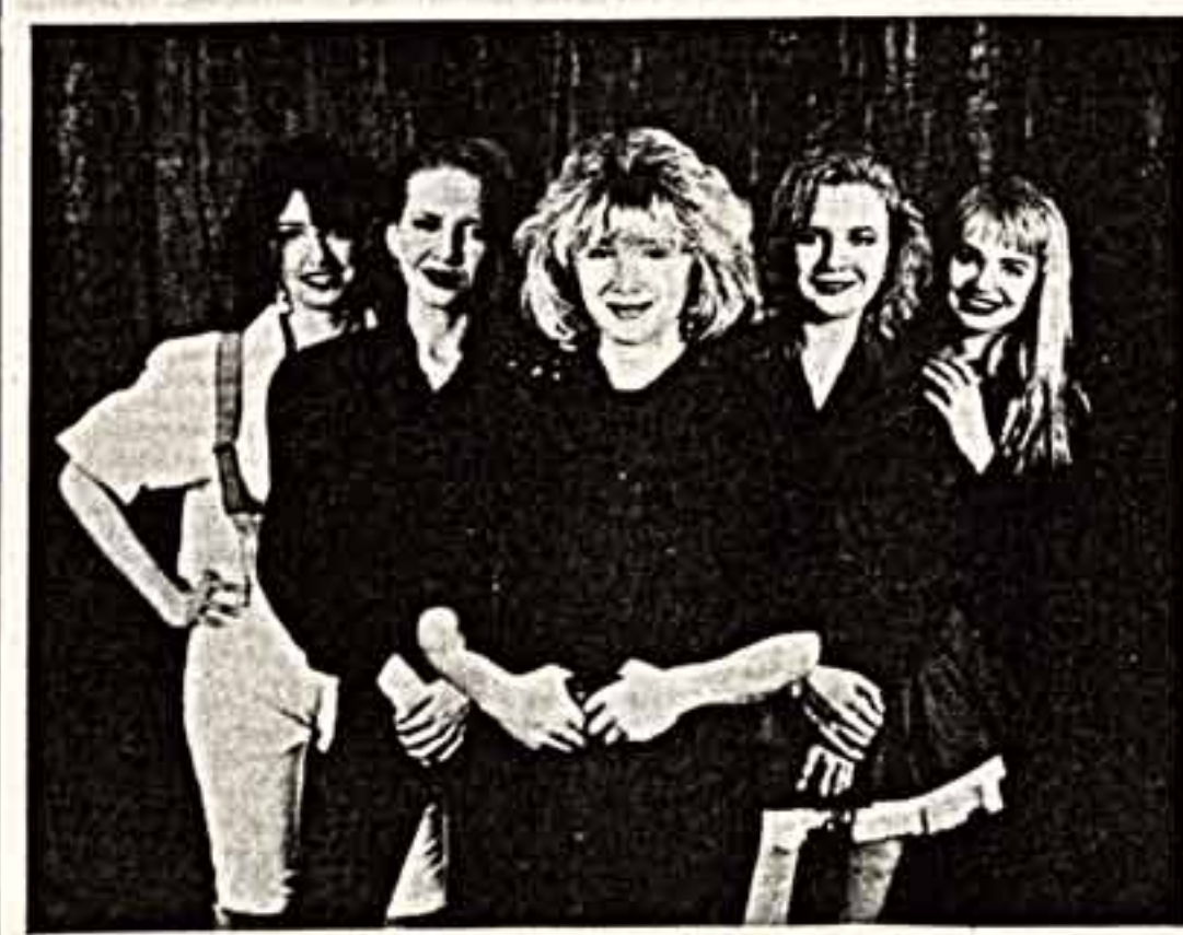
● Группа «Комби».