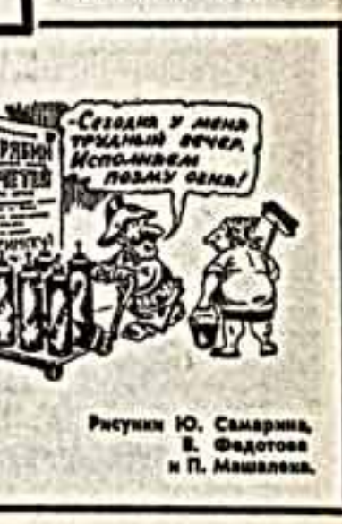
Рисунки Ю. Самарина, В. Федотова и П. Машалева.