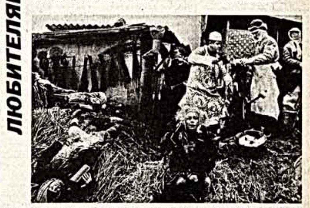
● Кадр из фильма «Старуха».

Зрелищизировать Хариса — дело заманчивое. Буйство фантазии, необы- чайная образность, иными героями в по- следнее время становились нарица- тельными, — что же еще? Не послед- нюю роль при выборе литературного материала для будущего фильма, без- условно, может сыграть и присталь- ный интерес к личности самого Да- ниила Исаевича: чужие восприя- тия одаренного, сильного и самым визуальным выходящим и трагиче- ским образом в творчестве во время ленинградской блокады. Но в то же время зрелищизировать Хариса — дело очень опасное. Поскольку зрите- лю, твердо установившему, что это искусство для нас важнейшим являет- ся кино, час хочется видеть на экра- не простоту, незамысловатость исто- рии по любви. Вот и поди выбери: то ли сделать что-то малопонятное широкому зрителю, то ли — что еще хуже — нарушить эстетику Д. Хариса. Кто решится на такое? До сих пор решались только театры. Даже фести- валь был провален — постановки по его произведениям, были и очень