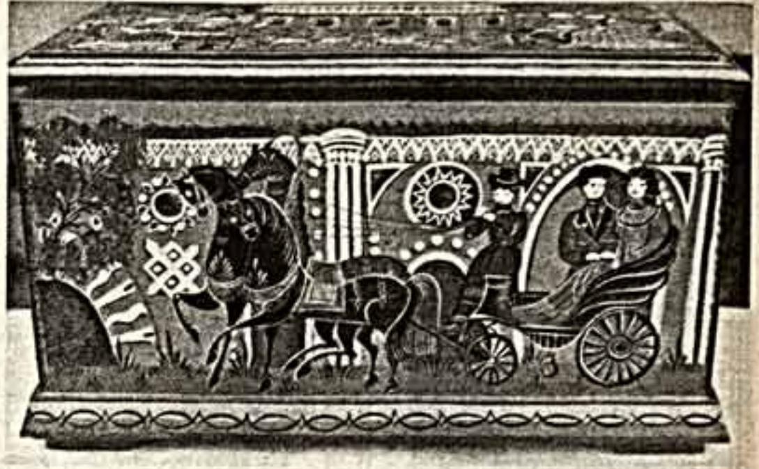
Ф. Касотова. «Праздник в Царицыне». Папко, Фрагмент. В. Чертова. «Прогулки в Царицыно». Роспись на суконке.

СССР идея необычайная — предложить современным мастерам городской росписи приглядеться к фантазиям, в Царицыне воплощенным.