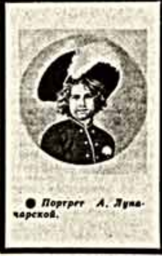
Портрет А. Луначарского.