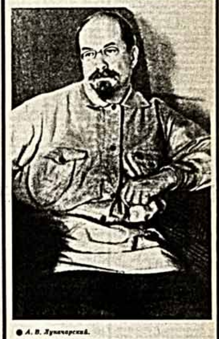
А. В. Луначарский.

Подвергая в последнее время пересмыслению и переоценке наше историческое прошлое, мы вновь и вновь обращаемся к событиям 1917 года. Извлеченные из архивов, новые для нас свидетельства современников и участников этих событий помогают лучше понять их и правильнее оценить. К таким материалам, безусловно, принадлежат недавно опубликованные Центральным партийным архивом письма А. В. Луначарского в журнале «Вопросы истории КПСС», № 11—12 (1990 г.), № 2 (1991 г.). До сих пор они были известны только в небольших отрывках и цитатах.