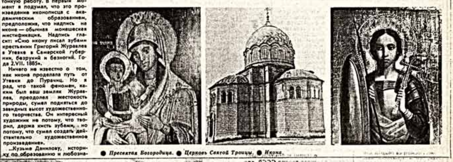
Пресвятая Богородица. Церковь Святой Троицы. Икона...

«...Ах, как просто утешать себя повторением магического заклинания: «зрители не горят!»...»