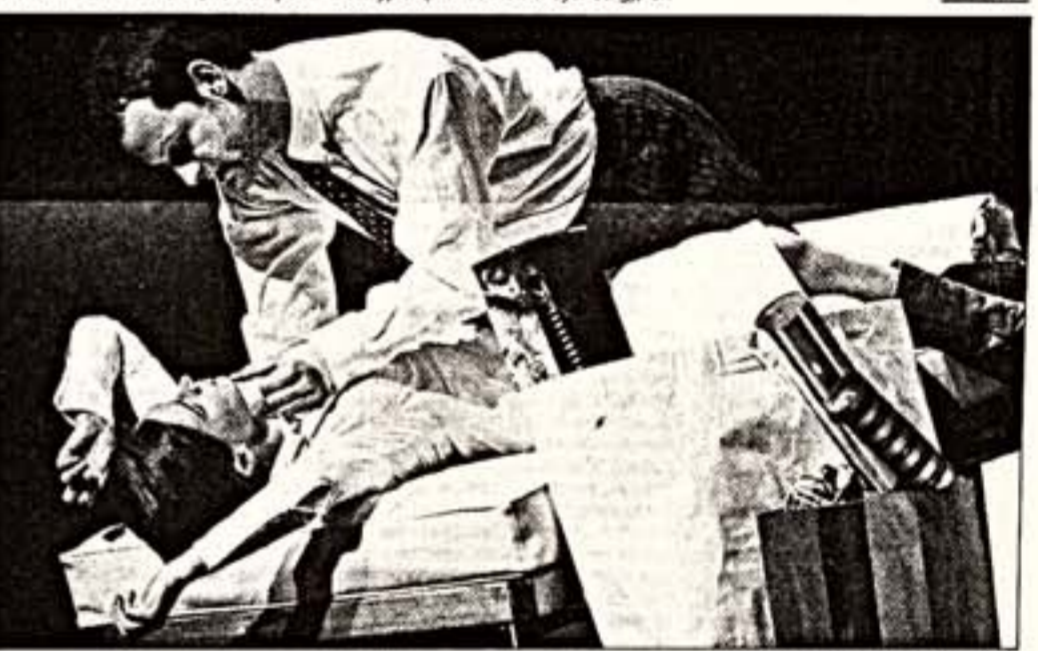
Сцена из спектакля "Нора"