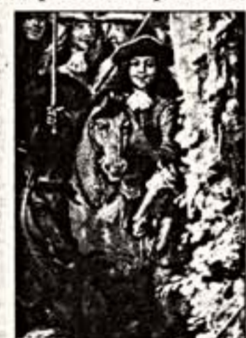
Портрет "настоящего" д'Артаньяна. Фрагмент картины ван дер Мейлена

330-летие со дня гибели капитана-лейтенанта королевских мушкетеров д'Артаньяна в Мaaстрехте отмечают фестивалем, посвященным этому знаменитому герою - уже в большой степени литературному, чем историческому. В программе фестиваля - выставки, концерты, демонстрации фильмов и спектаклей, семинары и лекции, презентация книг, экскурсии, гастрономические дегустации, посвященные самому известному гасконцу.