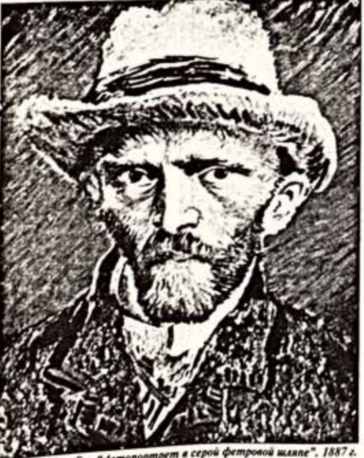
В. Ван Гог. Автопортрет в серой фетровой шляпе, 1887 г.