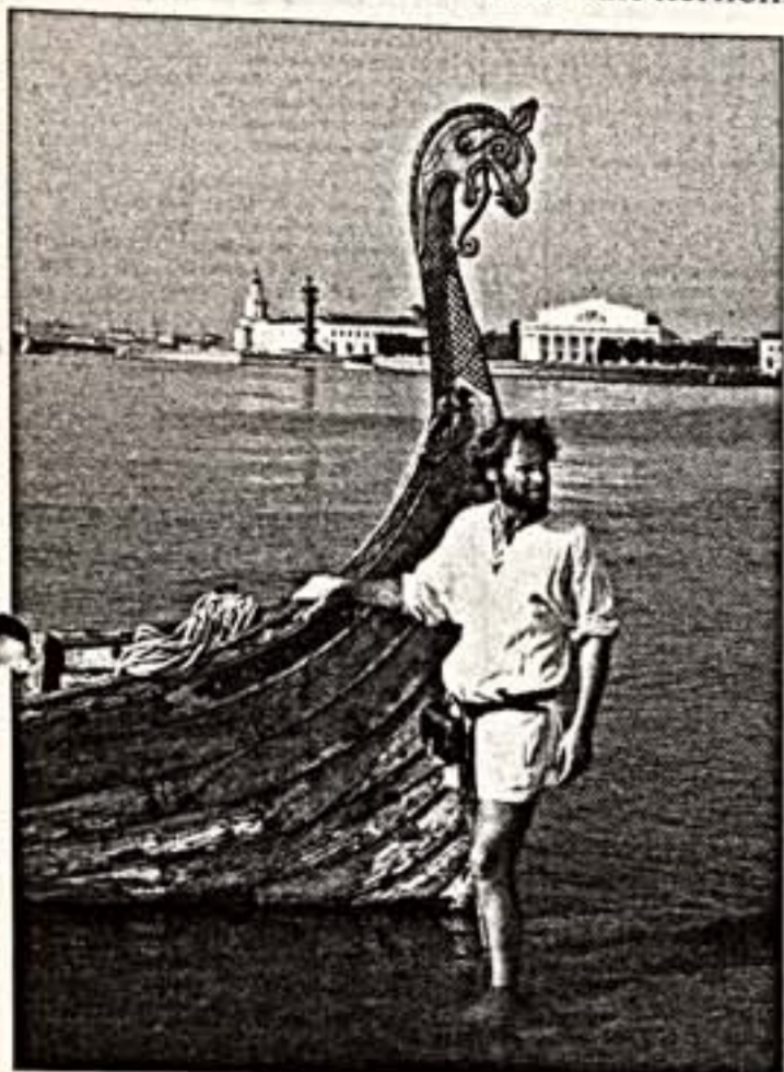
Слева: участники фестиваля "Деревня викингов"