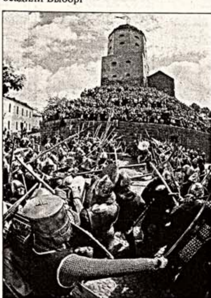
Справа: осада Выборгского замка

В конце июля в устье Невы вошли ладьи викингов. Более 100 по-томок шведского варягов на шести ладьях, составивших флотилию "Рюрик-2003", приплыли в Петербург, чтобы разбить свой лагерь. Деревня викингов Stofholm, шведский лагерь, который был построен на плече у стен Петропавловской крепости, стала одним из наиболее зрелищных и масштабных проектов, которые представили к 300-летию Петербурга.