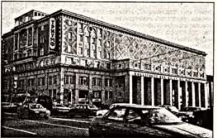
Зал имени П.И. Чайковского все еще принадлежит филармонии