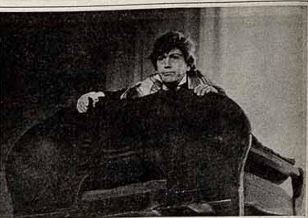
В театре имени Моссовета — премьера. Пьеса С. Белкина «Последняя левита Кралап» постановка режиссер Ю. Иванюскас. Сценическая композиция и сценография Г. Бортинкова.