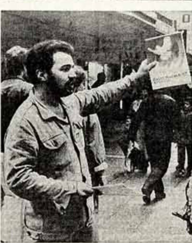
Организаторы всемирных маршей мира в ФРГ.

Интервью взял Р. СЕРЕБРЕННИКОВ, корр. ТАСС — специально для «Советской культуры», МАДРИД.