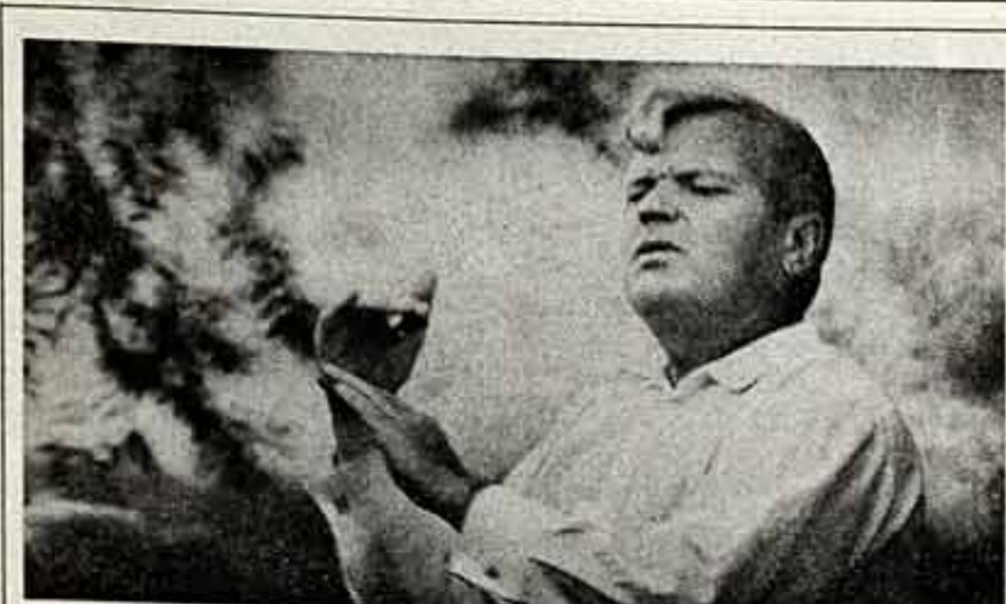
В Мундубашской средней школе № 15 состоялось торжество, посвященное 40-летию оркестра народных инструментов. Одним из удивительнейших оркестров нашей страны называл этот детский коллектив композитор Д. Кабалевский.