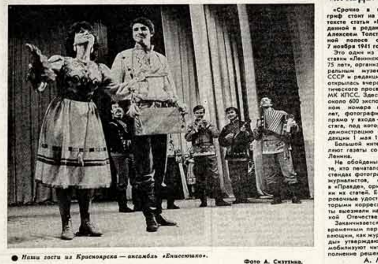
Наша гости из Красноярска — ансамбль «Енисейское».