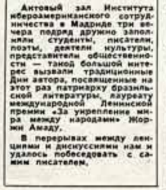
Античный зал Института интернационального сотрудничества в Мадриде три вечера подряд дружно заняты студенты писателя, поэты, деятели культуры, представители общественности — такой интеллектуальный интерес вызвала традиционная Дни автора, посвященные на этот раз патристичу бразильской литературы, лауреату международной Ленинской премии «За укрепление мира между народами» Жоржи Амаду.

кой. Было запрещено около 500 книг, причем многие из них под личным предлогом «аморальности». Сегодня бразильская литература переживает пору возрождения. Несмотря на большое жаровое и стилевое разнообразие, она характеризуется чрезвычайным единством. Да, она цельна и едина, ибо речь идет о литературе, обращенной к бразильской жизни, к народу, о литературе, пронизанной одной и той же проблематикой и базирующейся на реалистичности нашей страны. Вот уже два года я работаю над новым романом. Он посвящен проблемам бразильской молодежи. Действие книги разворачивается в конце 60-х — начале 70-х годов. Это эпоха, когда в Бразилии свирепствовала военная диктатура. Сколько деятелей культуры было изгнано из страны! Мой главный герой — мулат, он не учился в университетах и поначалу абсолютно не разбирается в политике. Однако постепенно зреет его политическое сознание, и он приходит к активному участию в народных выступлениях протеста. Это история политического прозрения, если хотите... Сейчас человечество переживает самый серьезный, наиболее ответственный момент в своей истории: под угрозой ядерного уничтожения оказались право человека на жизнь, само существование цивилизации. Разразилась ядерная война, она не поощряет ни левых, ни правых, ни христиан, ни мусуль-