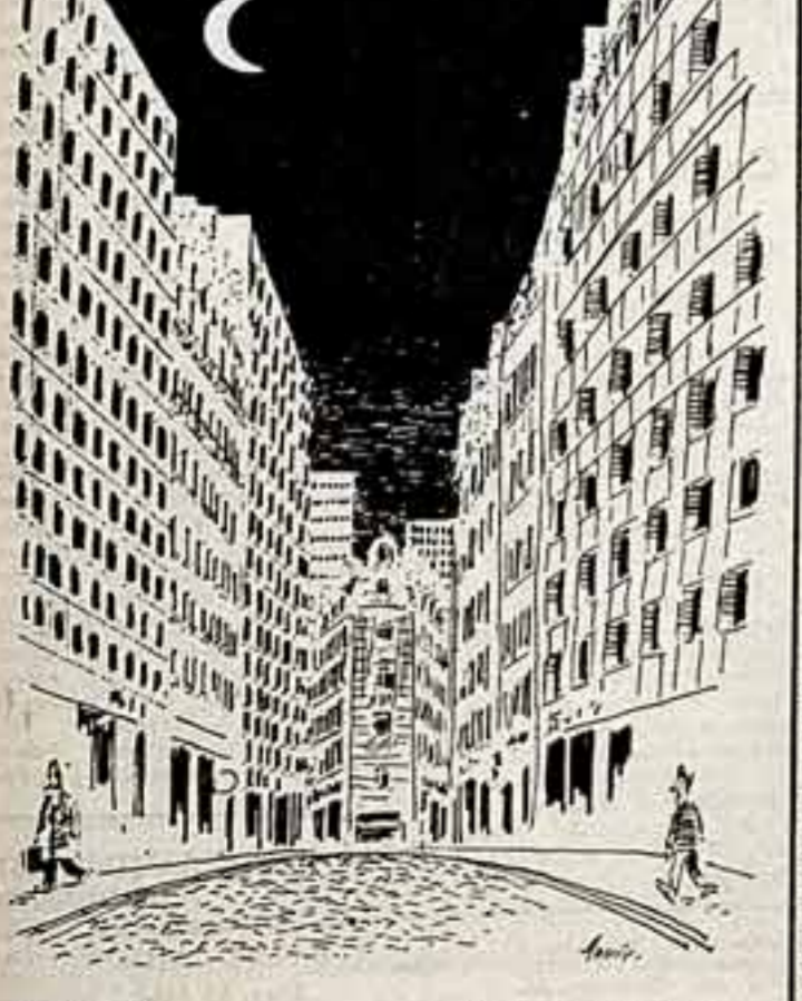
Карикатура из журнала «Пери-мич». Без слов.

За последние три года министерство обороны США разместило в 79 американских колледжах и университетах комплексы на исследования по про-