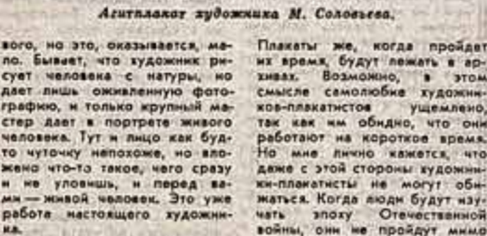
Агитплакат художника М. Соловьева.