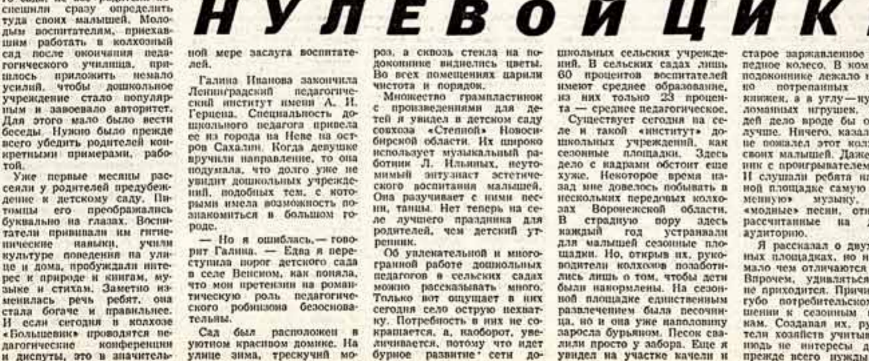
КАКИМ БЫТЬ ДЕТСКОМУ САДУ В КОЛХОЗЕ? — НУЛЕВОЙ ЦИКЛ

Б. КАНЦЕРОВ, ЮЖНО-САХАЛИНСК. В. СКИДАН, БЯНСК.