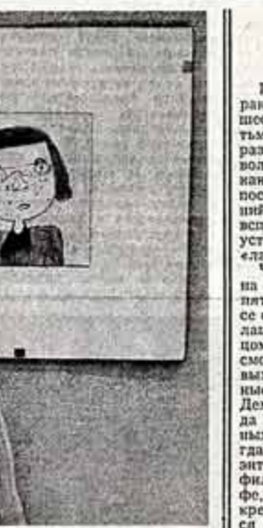
А. МЕДВЕДЕНКО, корр. ТАСС — специально для «Советской культуры».