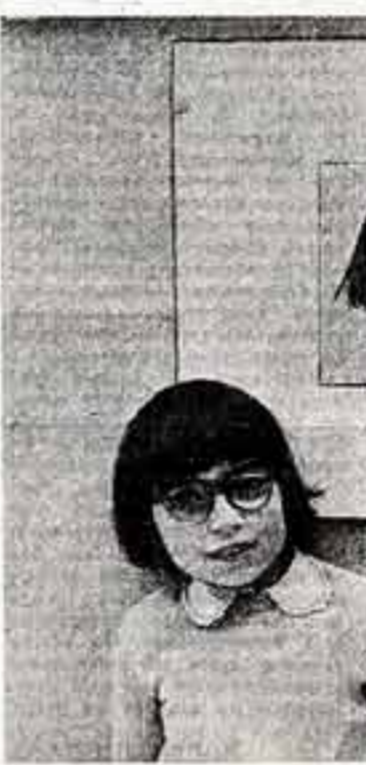
А. ПОТЕМИН, корр. ТАСС — специально для «Советской культуры».