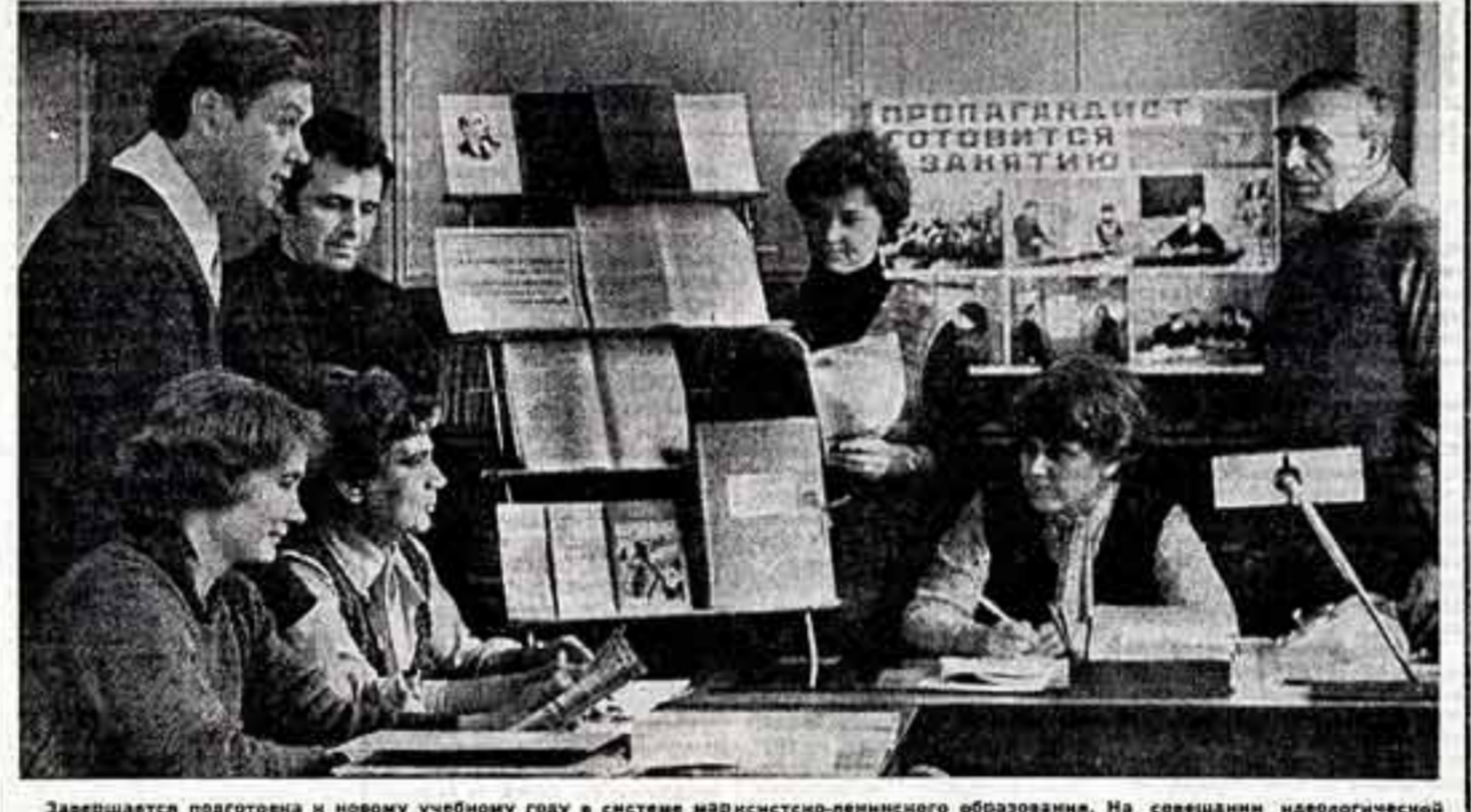
Заканчивается подготовка к новому учебному году в системе индустриально-педагогического образования. На совещании идеологической комиссии партии Московского машиностроительного завода «Знамя революции» идет разговор о проведении первого занятия по теме «В единстве с народом — сила партии. В единстве с партией, в ее руководстве — сила народа».

Для победителей конкурса устанавливаются восемь почетных премий.