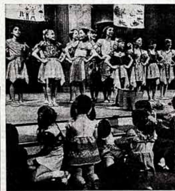
А. СМЕРНОВ, корр. ТАСС — специально для «Советской культуры».

Поезд пришел в Венецию рано утром — еще не было шести. В предвечерней тьме с трудом можно было разглядеть возвышающиеся в полях голланды, которые, как назло, еще дремали. Именно благодаря им после многочасовых планов по каналу, Ленино вспорхнула чайка, нехотя уступая дорогу тархатическому «лагунаму трамвайчику».