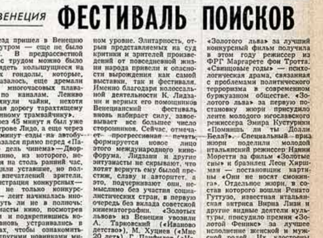
А. МЕДВЕДЕНКО, корр. ТАСС — специально для «Советской культуры».