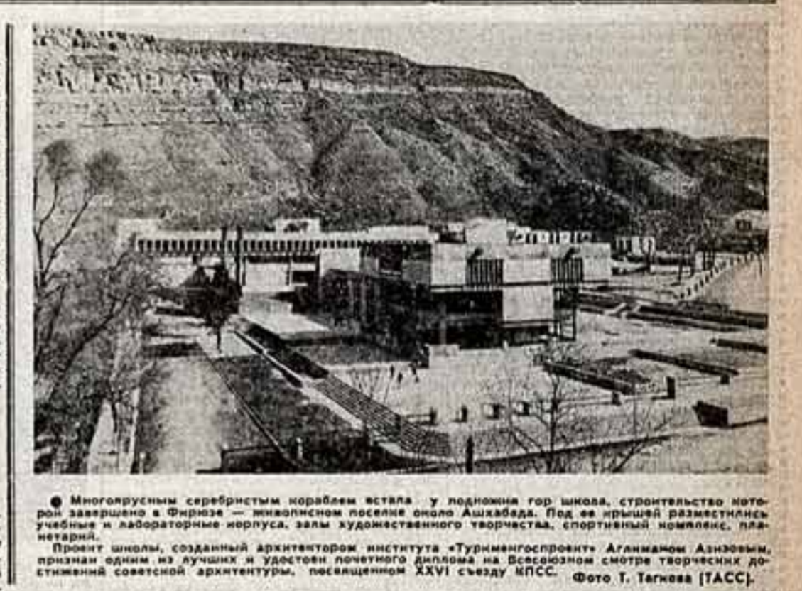
Многоэтажный серебристый мостовик встал у подножия гор Шумаве, строительство которого завершено в Фирше. Многоэтажное поселение около Ашхабада. Подъемный механизм, залы художественного творчества, спортивный комплекс, планетарий.

Особо хочу сказать о необходимости применения строгих мер в браконьерстве, о помощи населению инспекторам по охране природы. По нашим сигналам также строгие меры и браконьерам принимались неоднократно. И в то же время, учитывая, так проявляют организации общества в работе с детьми, школьниками — подростками. Только школьных лесничих — свыше семи тысяч. Посметенно несут дождь зеленые и голубые патрули школьничков. Таковы положительные стороны нашей работы. Но есть и недостатки. Например, очень мало у нас домов природы — этих методических центров, столь необходимых в работе. Плохо организована работа. Мы должны оказывать помощь членам общества в приобщении подросткового материала. Обращаются к нам миллионы садоводов-любителей. А полностью удовлетворить спрос на семена и саженцы мы пока не можем.