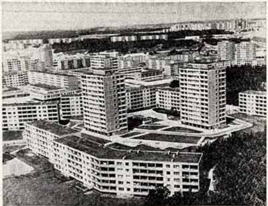
Там, где прошаги дорожи Великой Отечественной войны, ныне выросли жилые кварталы...

Оно как набат, как сигнал быть бдительными, как великий призыв к поколениям, живущим и будущим: «Пусть на земле торжествует мир!»