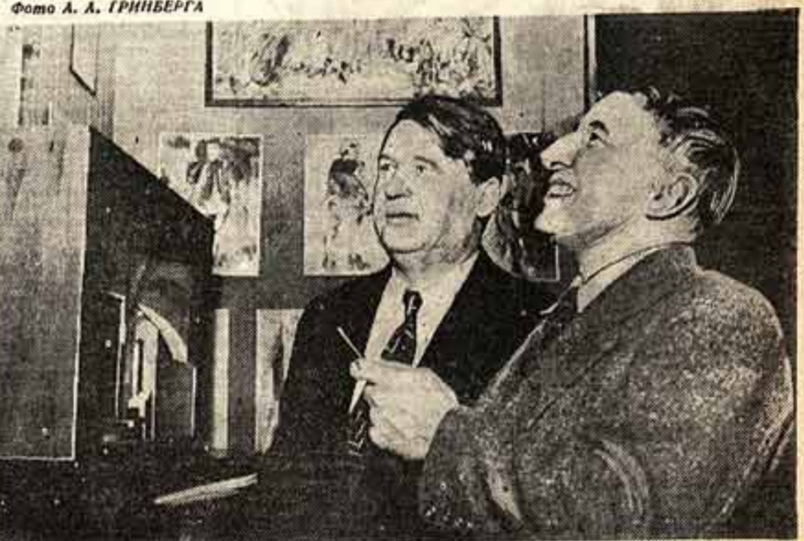
Народный артист А. Я. Таиров и художник А. В. Лентулов на открытии выставки

Создание такого методического пособия должно быть проведено в кратчайший срок Управлением театрами РСФСР.