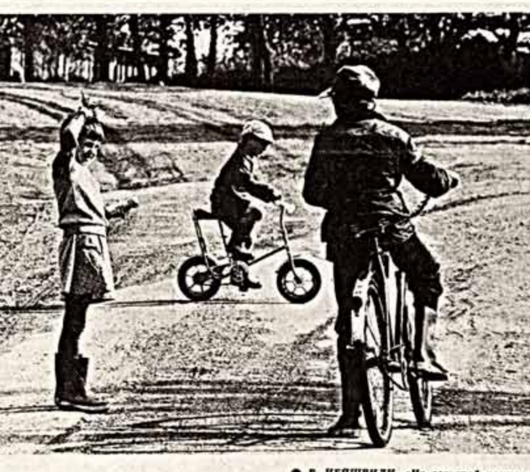
«На сельской улице».