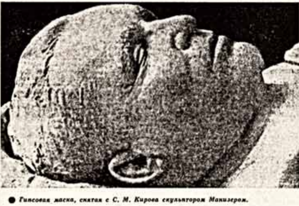
Гильзовая ядка, сбитая с С. М. Кирова скульптором Макизером.

Обращает на себя внимание такой, казалось бы, случайный факт: на страницах газеты помещены только сообщения от ЦК, от комиссии партинтотдела, соборования наркоматов обороны и тяжелой промышленности, Московского обкома и горкома. И почему-то явдур сообщено семье Кирова лично от секретаря Закрайкома... Берия!