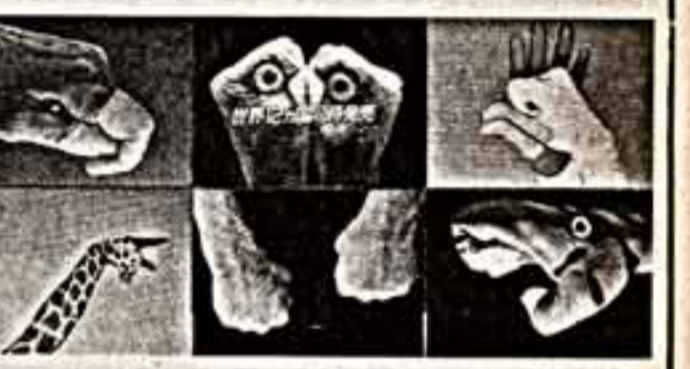
Фото из журнала «Тонко ньюслеттер» (Япония).

Это могли бы сделать и другие, но первыми сделали японцы. Выпущена иллюстрированная энциклопедия жизни животных, где, кроме фотографий и рисунков настоящих зверей, опубликованы изображения различных видов птиц, рыб, млекопитающих и пресмыкающихся, выполненные раскрашенными руками мастеров пантомимы Страны восходящего солнца.