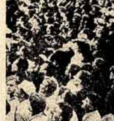
На снимках празднования Дня Воздушного Флота СССР в Тушине.

Воздушный парад на Тушинском аэродроме был красивым, величественным, праздничным зрелищем. Он продемонстрировал значительные успехи отечественной авиационной промышленности, вытеснившей в содружестве с иностранными новыми замечательными самолетами разных типов и разного назначения, рост мастерства летного состава Военно-Воздушных Сил, развитие авиационного спорта.