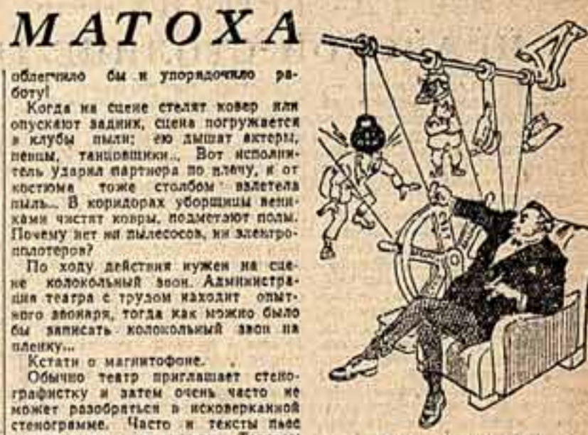
Связь — это искусство... Рис. С. АНДРЕЕВА.

Художник, стараясь переключить режиссера, «сшибает» в верхнюю лампу, чтобы желтое стекло в фойере зажегся светом. Неудачно такая релаксация в театральном обиходе называется «забой». Это действительно так: все участники спектакля уходят большими. А ведь ничего не стоит бы оборудовать в театрах радио- и телефонную связь во всех углах сценической работы. Насколько это