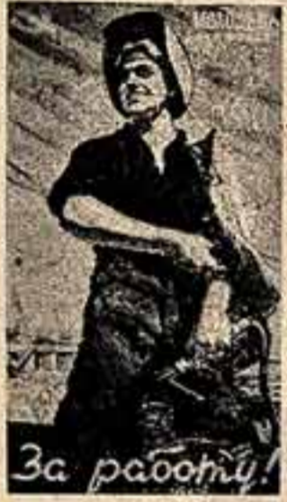
Панно художника В. Тишина на Мозга.

Быть на переднем крае борьбы и труда, там, где выдвигаются ответственнейшие задачи нашей социалистической Родины, стала благородной традицией многих и многих работников культуры и искусства.