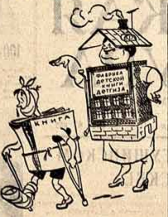
Мать и книга. Рис. З. ЗМОЛРО.