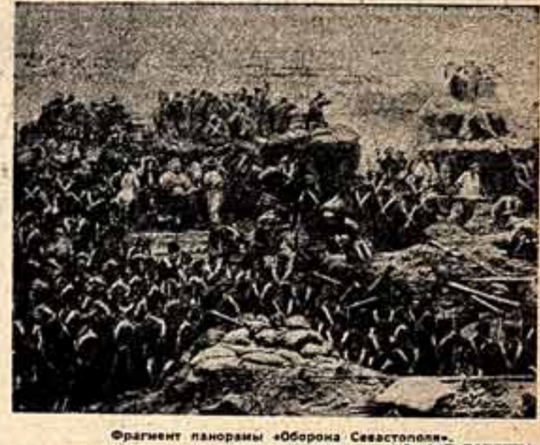
Фрагмент панорамы «Оборона Севастополя».

стать, отзывы посетителей панорамы. Ежедневно панораму посещают сотни людей. Сейчас поток экскурсионных панорамы «Оборона Севастополя».