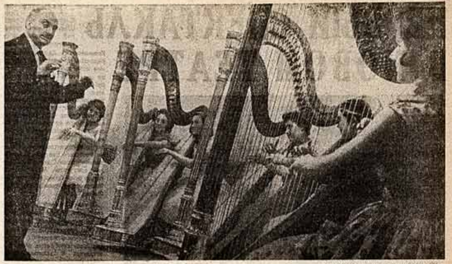
На репетиции...

Но как на сегодня обстоит дело? Доставляет ли мы радость нашим зрителям? И вот, если держать ответ по большому счету, надо сказать так: и да, и нет.