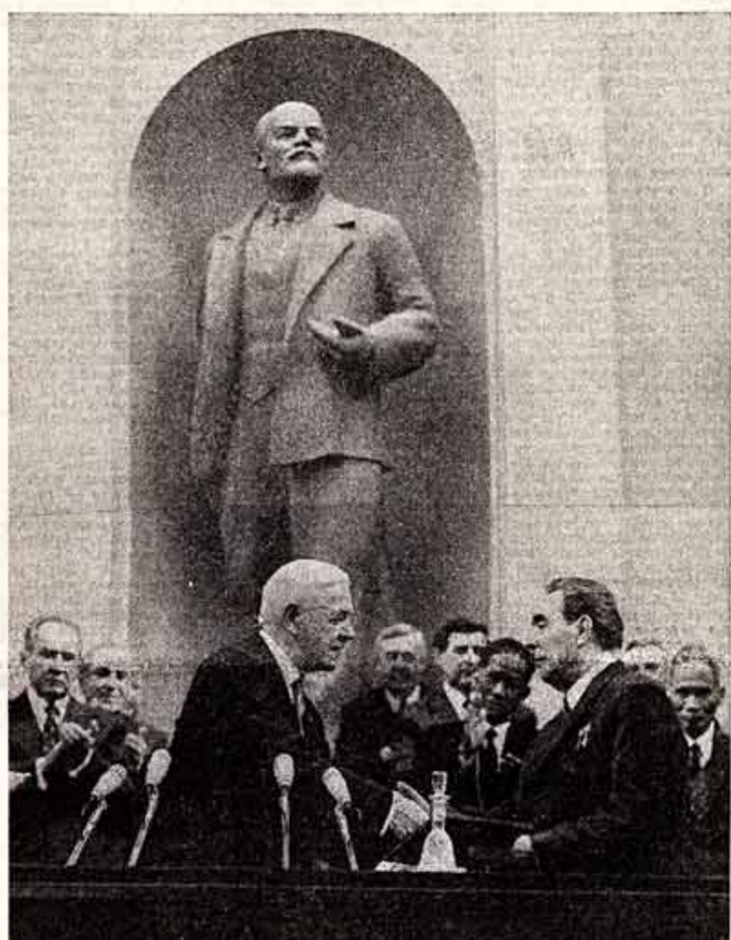
Москва, Кремль. 11 июля 1973 года. Вручение международной Ленинской премии «За укрепление мира между народами» товарищу Л. И. БРЕЖНЕВУ.