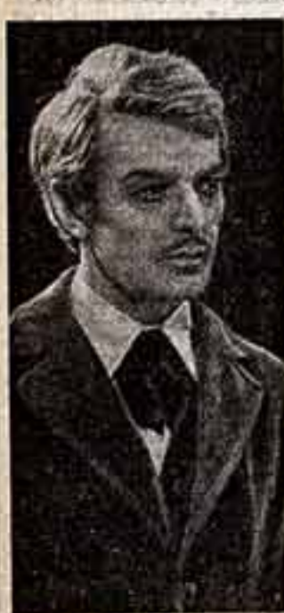
Олег Стриженов — Гауков.

На сцене Московского Художественного театра поставлена пьеса А. Н. Островского «На всякого мудреца довольно простоты».