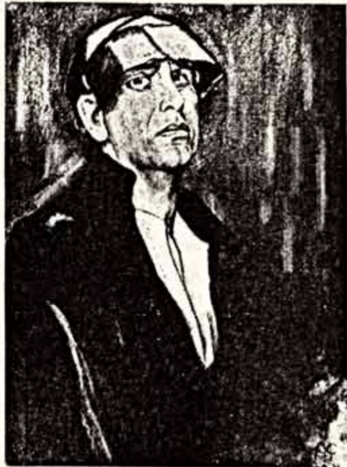
Третьяковской галереи (ныне его работы — в ряде советских музеев)...