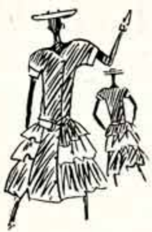
Безусловно, вы стремитесь и красоте — цвет сурового льна очень красиво сочетается с черным. Многие из того, что предлагается моде, может пригодиться и празднику. Но если нет возможности приобрести или сделать праздничный костюм, то ваше платье не новое, но любимое платье можно «оживить» брошью или косынкой. Модные салюты нового сезона. Рис. художника ОДМО С. Качарова.

Не выходит из моды морской стиль. Но в этом году он испытывает заметное влияние исторического костюма. Юбка и юртка из ткани цвета хаки с отделкой яркими вставками, иногда и набойкой тканью. Очень модно сочетание тканей различных рисунков, в том числе и «леопардовых». Модельеры советуют обратить внимание на пуговицы. С позавчерашнего каблук из незасухоустойчивым зобилим. Мы призываем относиться к пуговицам только как и застежкам, а ведь это великолепная декоративная деталь. Но не стоит решительно отказываться от каблук. Немного фантазии, и обыкновенная кнопка может украсить вашу модель. К примеру, кнопку можно поместить на цветной ленточке из отдаленной ткани. К сожалению, зобилим оказался не только пуговицам, но и летние пальто. Из моды сделать из плотной хлопчатобумажной ткани, в том числе из бархата или альфаты. Необычно выглядят накидки и пелерины из плащевых тканей.