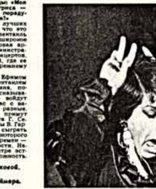
— Времени на все, конечно, не хватает, — сетует Ангелина. — Ведь надо еще и кинуть почитать, хозяйством по дому заняться... Буду счастлива, если мне удастся принять участие в московском конкурсе. Я к нему готова!

Монолог Клара Новикова.