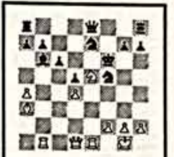
В шахматном наследии первого чемпиона мира есть и этюды. Попробуйте свои силы и здесь. Белья начнутся и выигрывают.

В позиции, которую мы предлагаем на этот раз, Стейниц играл черными. Найдите за два выигранных продвижения.