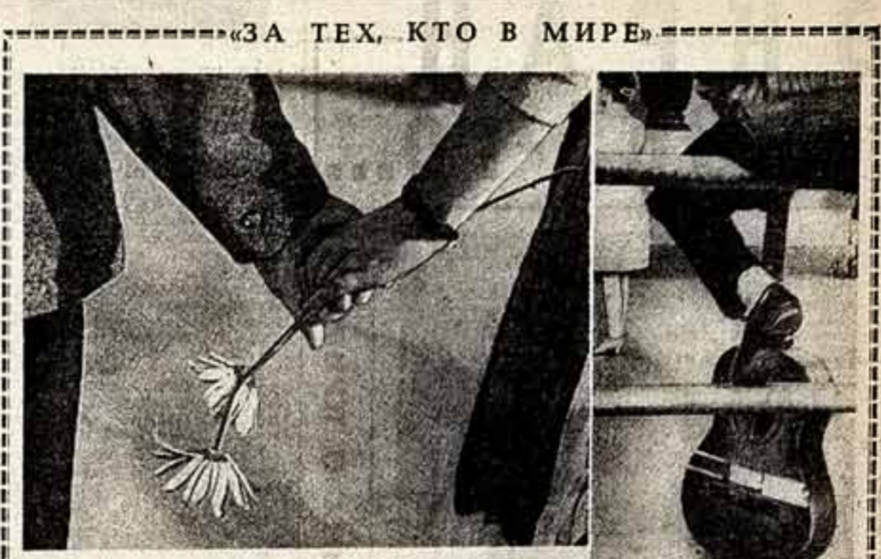
Май слонится она — твой низкий Любовь! Счастье!