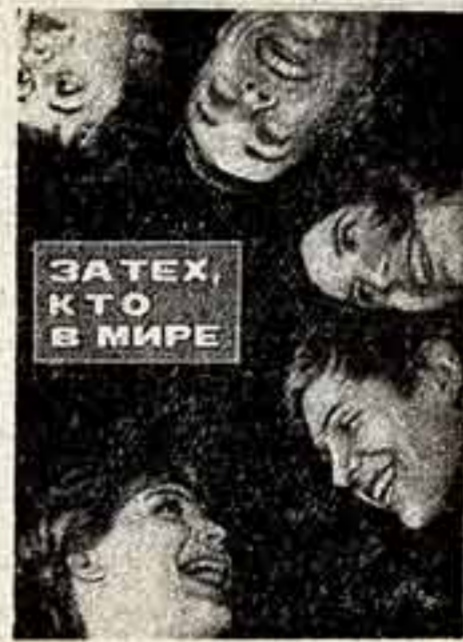
Сним. Н. Рахманов, Н. Степанов, Е. Умнов, Е. Халдей и многих, многих других. Выход в свет фотоповести «За тех, кто в мире» — бесспорная удача издательства «Молодая гвардия» и ИЛИИ.