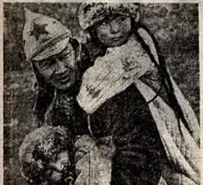
Дюшан — арт. Б. Вейсманна, фильм «Первый учитель» (студия «Киргизфильм»). Сценарий Ч. Айтматова, В. Доброблава при участии А. Михайлова-Кочаловского. Режиссер-постановщик А. Михайлов-Кочаловский.