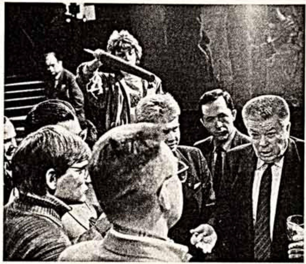
100 СТРОК ПО ПОВОДУ...

На заседании Политбюро ЦК КПСС рассмотрены некоторые другие вопросы экономической и социальной политики Коммунистической партии и Советского государства.