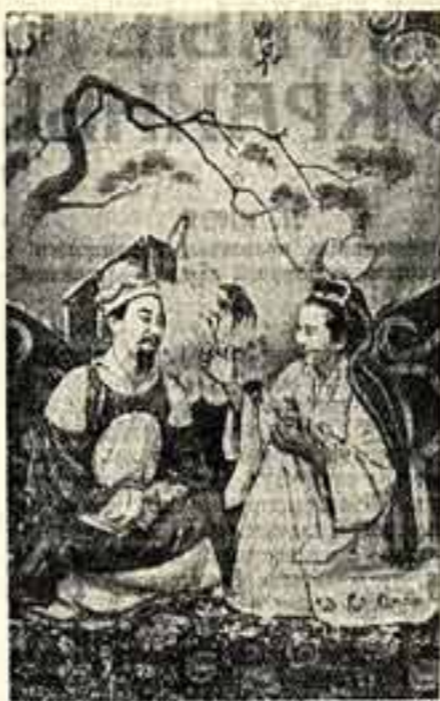
Таллы-Куран. Областной корейский музыкально-драматический театр — пользуется большой популярностью в Казахстане. Он существует почти четверть века. За это время театр осуществил более 150 постановок.

Приезд Александра — большое событие не только для семьи, но и для всего села, для всей округы. Местный судья, старая лиса, прожорливый вятюнчик Матвей Егорчян видит в Александре своего будущего сослуживца. Он уверен, что в скором будущем «стопки так и поплывут» в карман молодого юриста. Тереза — не прочь отдать свою дочь. Тереза же — женщина, перед которой открываются также перспективы. К тому же Тереза и Александр еще с юных лет неразлучными друг к другу.