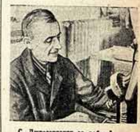
С. Джрагаджян за работой.

Юбилера приветствовали рабочие и специалисты типографии, представители Союза писателей и Госплана Армении. В заключение состоялся концерт.