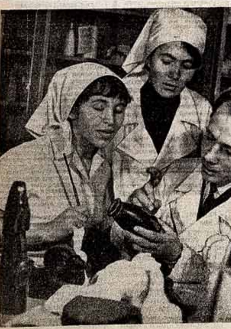
Ежегодно Отрадненская фабрика художественных камерных изделий дает продукции более чем на 500 тысяч рублей.

В 17 зарубежных стран — США, Англия, ФРГ, Франция, Швеция, Япония, Исландия, Австралия и другие — поставляют художественные изделия из гипсового камня камерных станций Отрадной Краснодарского края.