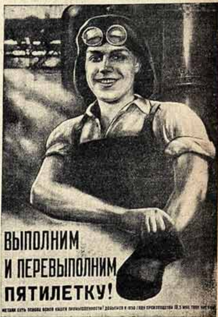
Плакат художника В. Корсакова из серии плакатов на тему новой сталинской пятилетки, выпущенных издательством «Искусство».

В организации этого грандиозного хора участвуют Дворец пионеров, школьные и пионерские организации.