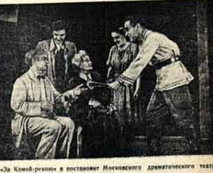
«За Комой-рекою» в постановке Московского драматического театра. Сцена из 3-го действия.

Каждому человеку положено счастье, — читает он вслух, обращаясь к другой девушке, убогой, бедной, несчастной, убогой, бедной, несчастной, убогой, бедной, несчастной, убогой, бедной, несчастной.